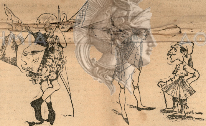
Ο Μάιος τής Πολιτικής