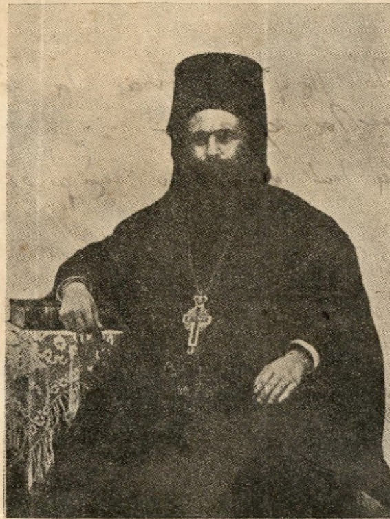
Ὁ ἀείμνητος ἐθνομάρτυς Μητροπολίτης Μελενίκου Κωνσταντῖνος Ἀσημαδής.

Ἐγεννήθη ἐν Καλλιπόλει τὸ 1872, ὅπου καὶ ἐδιδάχθη τὰ πρῶτα γράμματα. Τὰς θεολογικὰς σπουδὰς του ἐποίησατο εἰς τὴν ἐν Χάλκῃ Θεολογικὴν Σχολήν, ὅπου καὶ διέπρεψε διὰ τὸ ἥθος αὐτοῦ καὶ τὴν ἐπιμέλειαν. Ἐξελθὼν τῆς Σχολῆς τὸ 1902 προσελήφθη εἰς τὴν ὑπηρεσίαν τοῦ ἀειμνήστου καὶ σοφοῦ Μητροπολίτου Νικομηδείας Φιλοθέου Βρυεννίου ὡς Πρωτοσύγκελλος αὐτοῦ. Ἐν τῇ διακονίᾳ ταύτῃ ὑπηρετήσεν ἐπὶ ἐξαστίαν μὲ περισσὸν ζῆλον καὶ αὐταπάργνησιν, διὰ ταῦτα δὲ καὶ προήχθη εἰς Βοηθὸν Ἐπίσκοπον ὑπὸ τὸν τίτλον Χαριουπόλεως κατὰ τὸ 1908 πολλὰς παρασχὼν ὑπηρεσίας εἰς τὴν Ἐπαρχίαν Νικομηδείας, ἐργασθεὶς ἰδιαίτατα καὶ συντόνως διὰ τὴν ἐκπαίδευσιν καὶ συντελέσας εἰς τὴν ἀνοικοδόμησιν σχολείων καὶ εὐκτηρίων οἴκων ἀνά τὰς διαφόρους Κοινότητας τῆς ἐν λόγῳ Ἐπαρχίας.