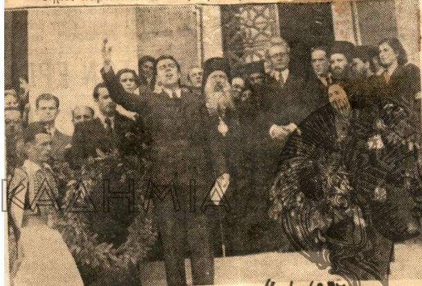
Είς έκ των φοιτητών έκφωνών λόγον πρό της στέψης των ανδριάντων εις το Πανεπιστήμιον.