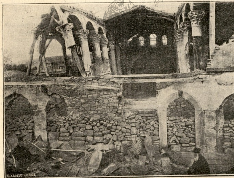
ΟΙ ΤΑΞΙΑΡΧΑΙ ΤΟΥ ΑΓΙΟΥ ΕΥΘΥΜΙΟΥ [Ναῖκαροῦ Παιδεστοῦ.]