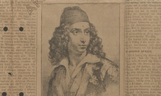
Ὁ πατέρς εἰς τῆς Δόμνας Βαβίξη μὲ φουστανέλλα, τὴν ἐποχὴν ποτὶ ἐστὶν μὲ τὰ ἄλλα παῖδια τῶν ἀρχηγῶν τοῦ ἀγῶνος εἰς τὸ Παρεῖαι.