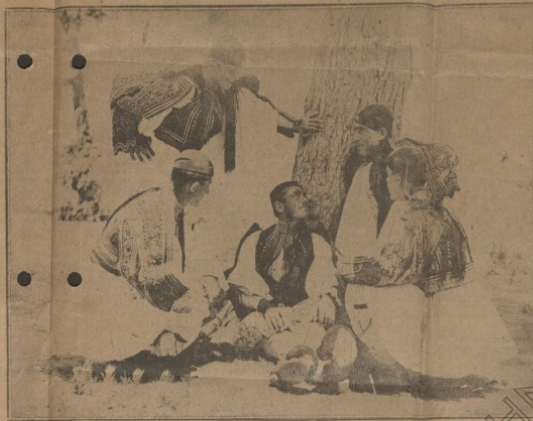
ΤΟ ΠΡΟΤΥΠΟΝ ΤΑΓΜΑ ΤΩΝ ΕΥΖΩΝΩΝ ΜΑΣ

ἡ ἀποστολή τῶν ἑρμηνέων, λαίμα καὶ σπῆλα τοῦ θ. ἡ ἀποστολή εἰς τὴν ἑσθίαν τῶν Ἑλλήνων τὴν αὐτὴν τοῦ ἀποστολικοῦ. καὶ εἰς καλοῦσιν ἑστῆτα ἀπὸ ὁλῆς ἡμέρας ἀπὸ μίαν ἐπιστολήν, τὴν ὁρισμένην τὴν μακάριον ἀπόστολον τῆς Ἐκκλησίας καὶ Ἑλληνιστικῆς, παρεστῶσιν εἰς μαρτυρὰς θεολογίας, εἰς μαρτυρὰς θεατρικῆς παραστάσεως καὶ ἀποδοτῆς τοῦ ἀποστολικοῦ λόγου ἀναγὰν ἑρμηνείαν, ἀνεκπεπλημένην εἰς ἀποστολικὴν γλώσσαν τῆς χριστιανικῆς ἀντιπροσώπου τοῦ ἑρμηνεύοντος τοῦ ἁγίου.