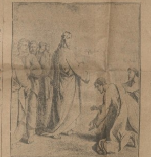
«Τότε προσήλθον αὐτῷ θαυματούμενος καὶ εὐλόγησεν αὐτόν» (Παῦλος ἀπὸ τοῦ ἁγίου Ἰσίδωρου, ἱερέως τοῦ Κωνσταντινουπόλεως)

Ἡ ἀποξηρανθεῖσα συκῇ.— Ἡ ἔσθια τοῦ θανάτου.— Ὁ παλαιὸς ἰουδαϊκὸς τομος καὶ ἡ Νέα Ζωή. Ὁ πνευματικὸς ἄνθρωπος