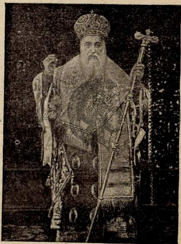
Ὁ Οἰζουμενικὸς Πατριάρχης ΣΩΦΡΟΝΙΟΣ Γ'.