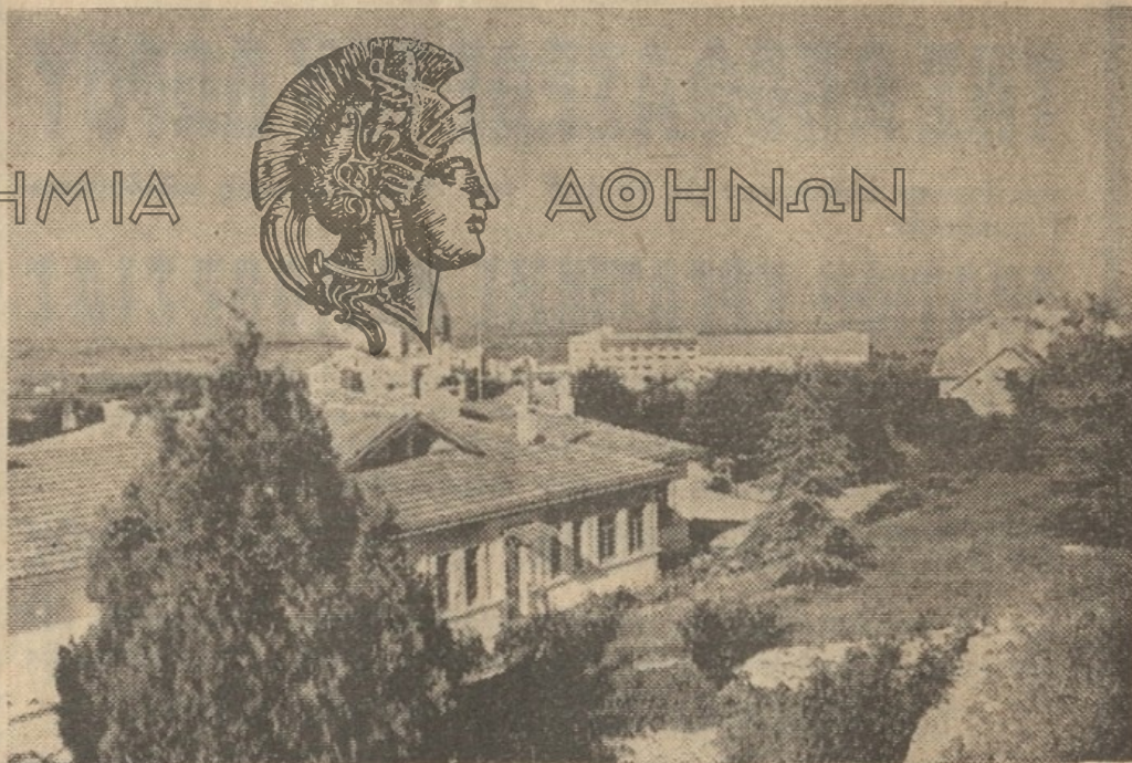
Τὸ ἐργοστάσιον ζακχαρέως τῆς κωμοπόλεως Ἀλπαλλοῦ

ΑΠΑΓΟΡΕΥΕΤΑΙ Ἡ ἘΝ ὈΛΩ Ἡ ἘΝ ΜΕΡΕΙ ΑΝΑΔΗΜΟΣΙΕΥΣΙΣ ΑΝΕΥ ΕΓΓΡΑΦΟΥ ΑΔΕΙΑΣ ΤΗΣ «ΜΑΚΕΔΟΝΙΑΣ»