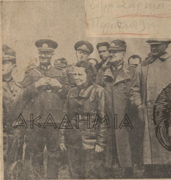
Ὁ Κεμάλ 'Ατατούρκ φωτογραφούμενος μετὰ τῆς θετῆς του κόρης, τῆς ἀεροπόρου Σαμπιχά.

κλατικὴν κίνησιν. Κατὰ τὴν γνώμη του τὸ σχέδιον ἦτο θαυμάσιον. Θὰ ἔβγαζε τὸν στόλον ἀπὸ τὸν Κεράτιον κόλπον. Ὑπὸ τὴν προστασίαν τοῦ στόλου τὸ 10ον σῶμα στρατοῦ θὰ ἀπεβίβαζέτο