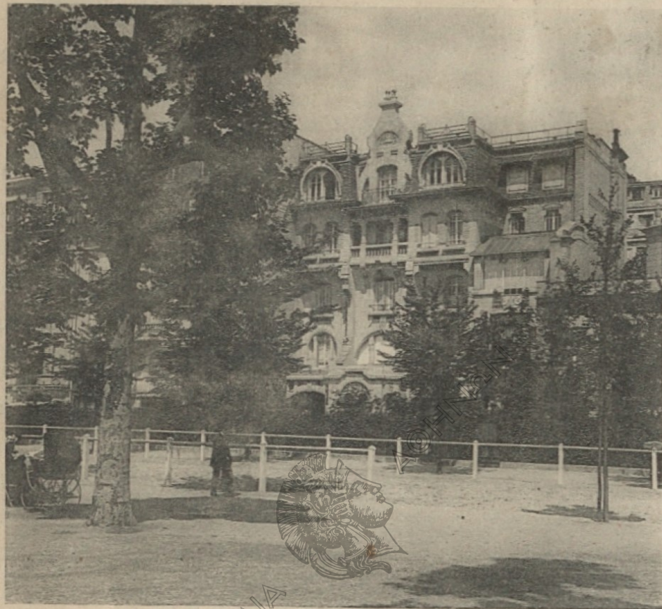
PARIS (VII) — 16, AVENUE ÉLISÉE RECLUS

portons bien, sauf cependant moi qui suis assez fatigué depuis déjà 10 mois et qui ai même dû cesser quelque temps de travailler. Je souhaite que tout aille bien pour vous et votre pays et je vous prie de faire nos compliments à votre famille et de me croire votre tout dévoué G. E.