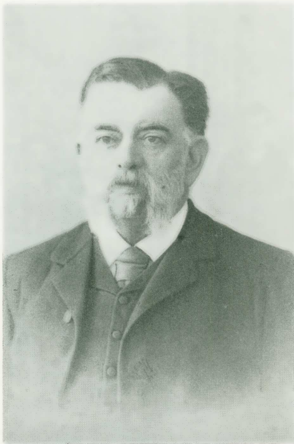
Είκ. 2. Ἀναστάσιος Χρηστομάνος.