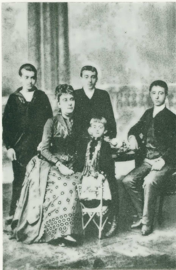
Εικ. 1. Ἡ οἰκογένεια Χρηστομάνου.