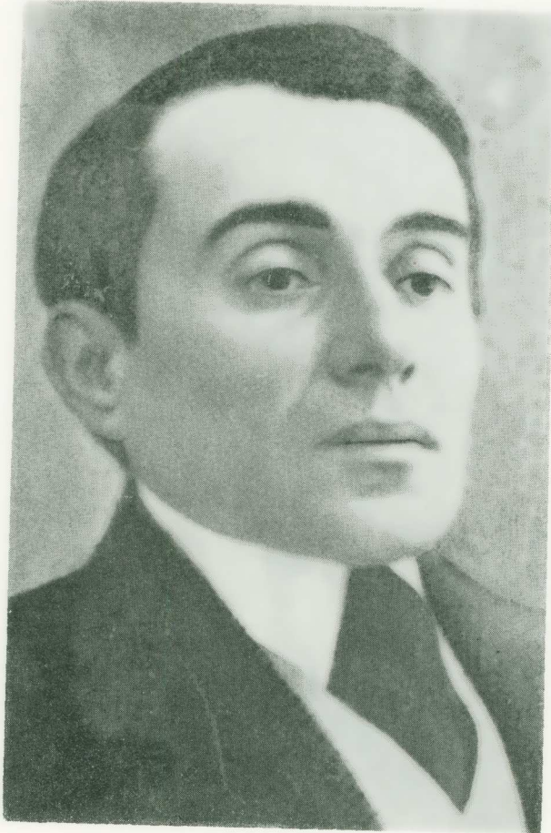
Εικ. 3. Κωνσταντίνος Χρηστομάνος.