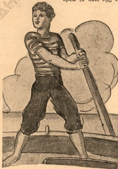
Ήτανε τό δελφί- νι του νησιού.

Δώδεκα μέρες τίποτε δέ φάνηκε. Γυρίζοντας κάθε βράδυ άπελπισμέ-