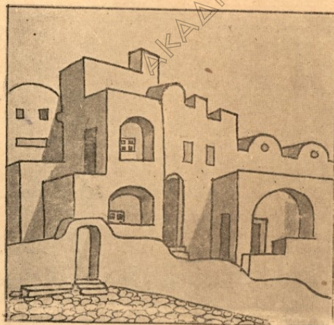
Ένα απ' τά Ιδιόρυθμα σπιτάκια της Σαντορινής.

Και μιά ώραία ημέρα, που οι κάτοικοι κατεγίνοντο άμέριμοι στις εργασίες των, ένα μαύρο σύννεφο έπρό-