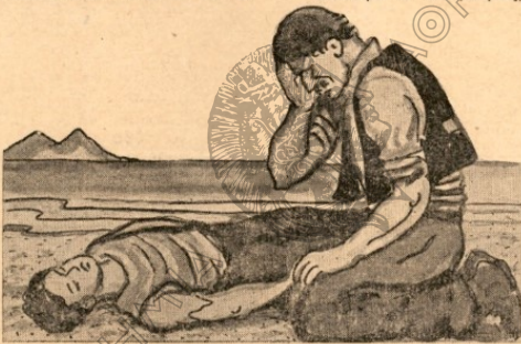
Και γονατιστός έκλαψε με τό πόνο του πατέρα.