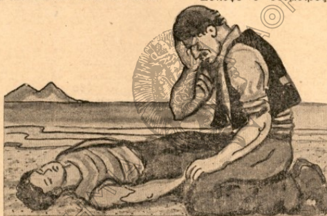
Και γονατιστός έκλαψε με τή πόνο τού πατέρα.