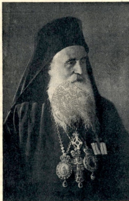
Η Α. Σ. Ο ΜΗΤΡΟΠΟΛΙΤΗΣ ΠΡΩΗΝ ΛΑΓΚΑΔΑ