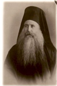
218 ἔτος 1911