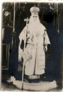
+ ὁ Ἱεροῦ