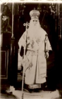
ἐν Ἀβραχῇ 1/1/1940