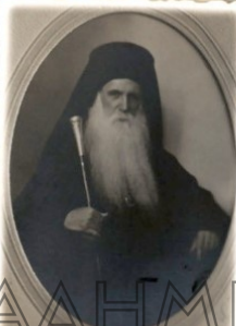
+ ὁ Ἱεροῦ