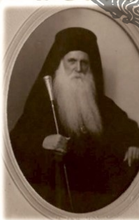
12.4 π. 1931