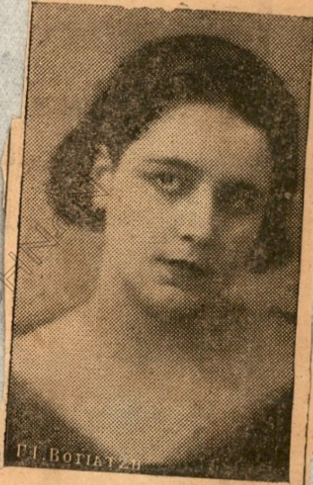
Ἡ Δὲς ΦΡΟΣΓΝΗ ΚΟΥΓΑΚΑΚΟΥ

Ὁ ὠραιοκόσμος, λοιπόν, τῆς πόλεως μας ἀπὸ προχθὲς μὲν ἔμαθε τὴν ἀ- γοποιημένην κἀπὸς ἀπόφασιν τῆς Ἐ- νώσεως Δημοσιογράφων ἀνεπαύθη. Κατόπιν τούτου ἕνα ζήτημα ἀνε-