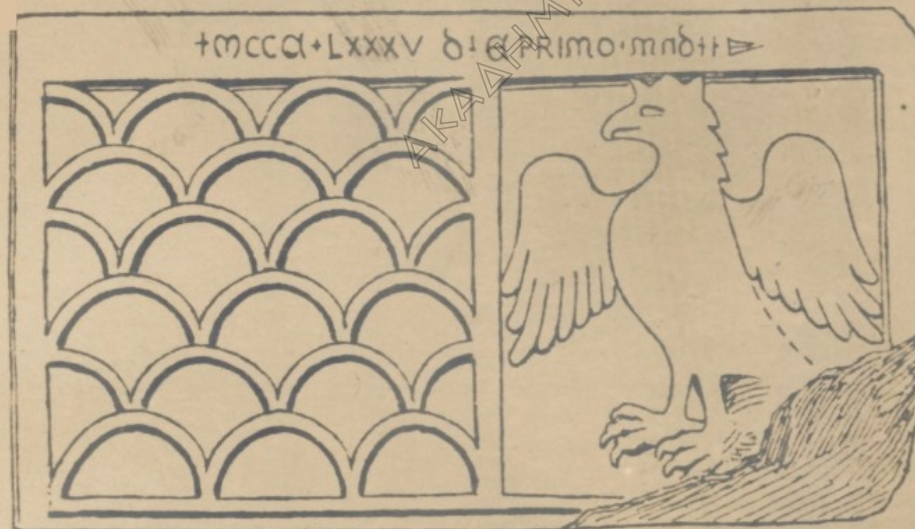
FIGS. 5, 6, 7.—AENOS: INSCRIPTIO