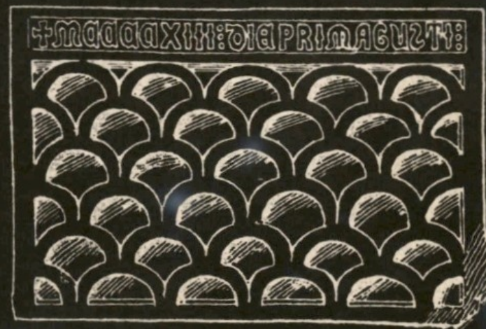
FIGS. 6, 7.—AENOS: INSCRIPTIONS (2), (3), (4).