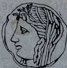
ΑΡ. Θ. ΜΟΥΡΑΤΟΓΛΟΥ ΓΕΩΠΟΝΟΥ

ΕΚΔΟΣΙΣ ΕΛΛΗΝΙΚΗΣ ΓΕΩΡΓΙΚΗΣ ΕΤΑΙΡΕΙΑΣ ΚΟΙΝΩΦΕΛΟΥΣ ΙΔΡΥΜΑΤΟΣ ΔΗΜΟΣΙΟΥ ΔΙΚΑΙΟΥ ΒΡΑΒΕΥΘΕΝΤΟΣ ΥΠΟ ΤΗΣ ΑΚΑΔΗΜΙΑΣ ΑΘΗΝΩΝ