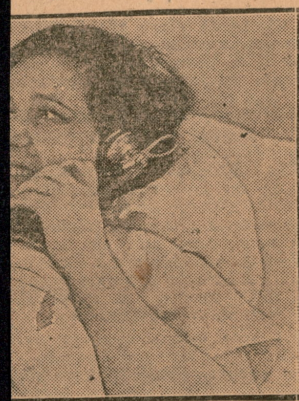
ΙΝΙΚΑΣ της νέας Ρωσίας ά-έπικοινωνία της λεχούς με τον συνδιאלόγωνται τηλεφωνικώς Ι...

μείωσεν έσχάτως και η βιομηχανία. ‘Αρκει να αναφέρωμεν έν παράδειγμα: Κατά τάς αρχάς του 1933 η παραγωγή χυτοσιδήρου ήμερησίως μόλις έφτανε τάς 14 χιλ. τόννους. Τόν Δεκέμβριον του ίδιου έτους έδιδε καθημερινώς 24 χιλιάδες τόννους. ‘Η βιομηχανία των αυτοκινήτων και των τρακτέρ, η βιομηχανία γαιανθράκων και δ-