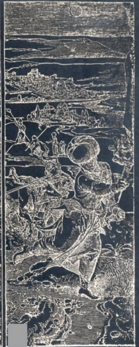
VUE DE LA PLAINE ET DE LA VILLE DE PHILIPPOLI