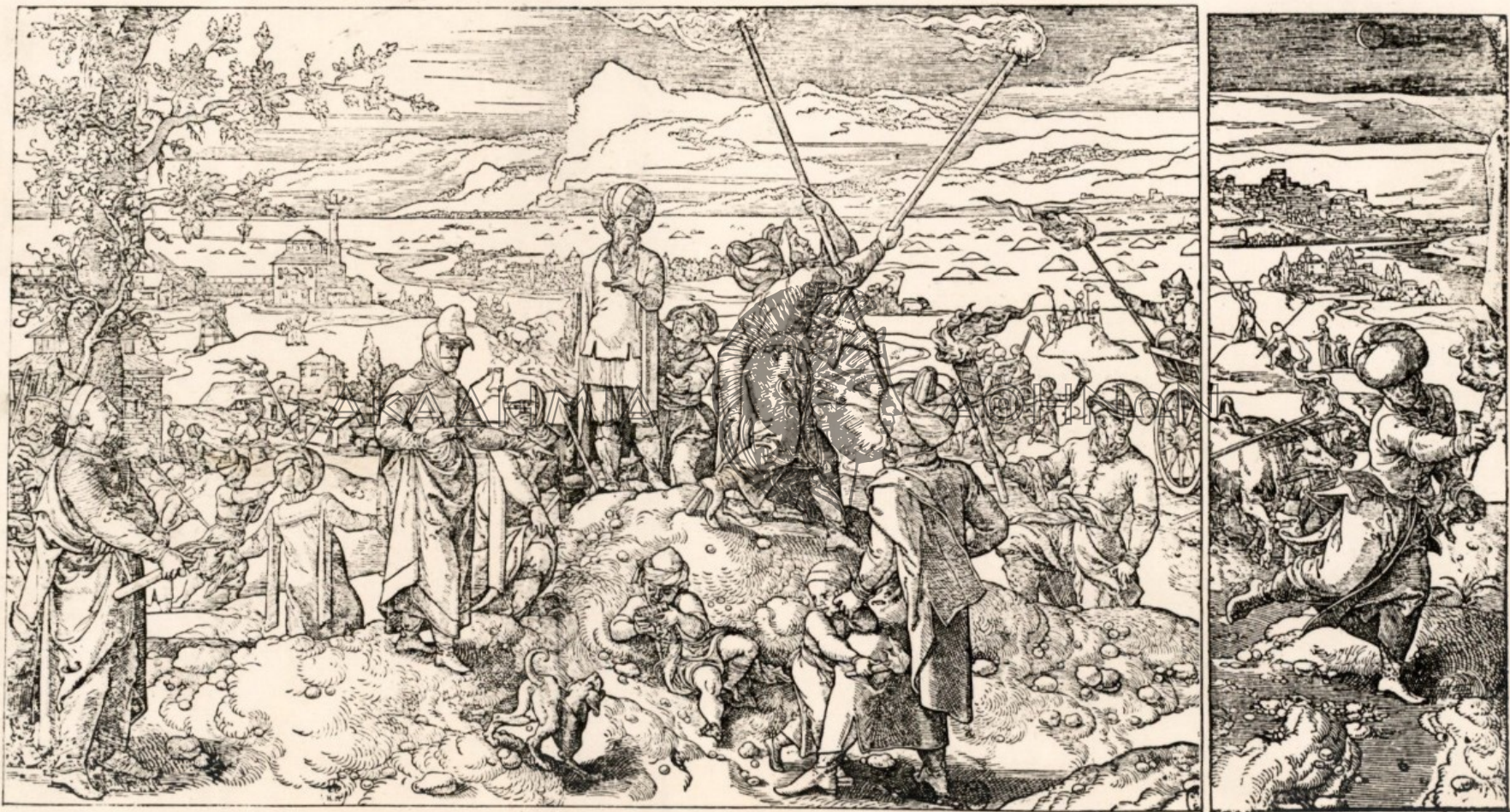
Planche partielle une suite de 17 g 2 - vues sur le site d'un exhâte - terre exalté! Problème - nel à Avon dans le Précis maître du XVI e s. Et selon le rapport de l'arché- ologue elle doit être par un par arché qui a été que un des de l'Al- Rochelle Bendin L'ensemble est en- cité à l' année 1536 Canoa sedition