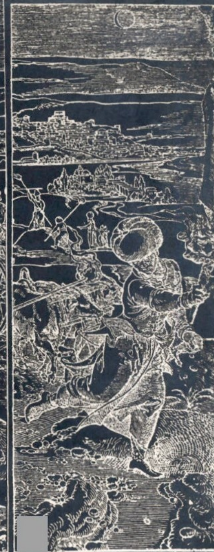
VUE DE LA PLAINE ET DE LA VILLE DE PHILIPPOPOLI