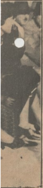
...εἰς ὄλην σε- ...τοῦ Διαδόχου ...τῶν ἑλλεινομέ- ...λευρὰν τῶν θα- ...τοῦ...Διαδόχου

πίλλης ἀπὸ τὴν ἀπόστασιν ἑκατῆν, καὶ ὁ Χόλμπρουκ ἀπεφάσισε νὰ πλησιάσῃ ὅσον τὸ δυνατὸν περισσότερο. Τὸ ἀγκυροβολημένον πλοῖον ἔφερε τὴν τουρκικὴν σημαίαν καὶ δέν ὕπῃρχε καμμία ἀμφιβολία, ὅτι ἦτο πολεμικόν, φορτωμένον μετὸ τηλεβόλα ἀπὸ ὅλας τὰς πλευρὰς του. Ἐπάνω στὸ ὑποβρυχίον ὄλοι εὐρίσκοντο εἰς τὰς θέσεις των, σιωπηλοί, με εὐλογον συγκίνησιν. Ὁ ἔχθρος, ὁ ὁποῖος ἀκόμη δέν εἶχεν ἀντιληφθῆ τίποτε, εὐρίσκει τὸ πολὺ κοντὰ, εὐκόλῃ λεία, ἀν-