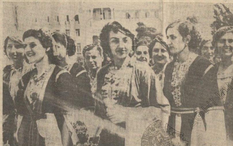
Οι χαριτωμένες Θρακιστοπόλεις πού με την ώραίαν τους εμφάνισιν και τους γραφικούς χορούς των απέσπασαν όλον τόν θαυμασμόν των έπισήμων και των κοινού έξ' Αθηναϊκόν Στάδιον.

λά σημεία είχαν άνηρτηθή εις κόνες της Α. Μ. τού Βασιλέως και τού Εθνικού Κυβερνήτου Ι. Μεταξά. Είς τά κεντρικά σημεία της πόλεως είχαν σπηθή μεγαλοπρεπείς άνθίδες με φωτεινάς έπιγραφές αι όποιαι άνέγραφον «Ζήτω ό Βασιλεύς, Ζήτω ό Εθνικός Κυβερνήτης, Ζήτω ή 4η Αυγούστου». Τοιαύται έπιγραφαι μικραί και μεγάλαι με εικόνας τού Βασιλέως και τού κ. Πρωθυπουργού είχαν τοποθετηθή παντού. Ο όλος έορταστικός διάκοσμος της πόλεως προσέδιδε ιδιαίτεράν αίγλην εις τόν λαϊκόν πανηγυρισμόν της Ιστορικής επέτειου.