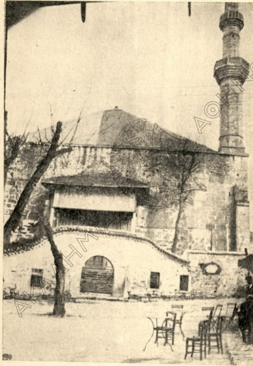
Ἡ πρόσοψις τοῦ τεμένους μετὰ τοῦ κατεδαφισθέντος τοίχου. Ὁ ἐπὶ τοῦ τοίχου κύκλος δεικνύει τὴν θέσιν τῆς ἐπιγραφῆς

«Ὁ εἰς τὴν δύναμιν τοῦ ἀρχαίου (ἀνάρχου) δημιουργοῦ καὶ πανταχοῦ παρόντος ὕψιστου Θεοῦ κτεφυγῶν (ἰ.λ. ὁ ἀρχιτέκτων