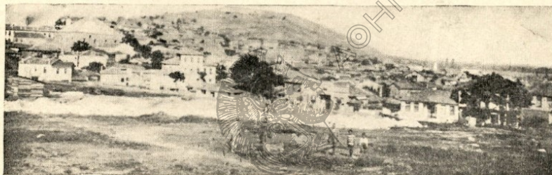
Ἐκ τῆς ἀποψὸς τῆς μεγάλης ἀκροπόλεως μετὰ τοῦ τεμένους.

Τὰ θεμέλια εἶναι βαθύτατα καὶ ἰσχυρά. Οἱ δὲ τοῖχοι λίαν στερεοὶ καὶ πάχους 2 μέτρων ἀπὸ τοῦ ἐδάφους μέχρι τῆς στέγης. Ἔχει τρεῖς μεγάλας θύρας, ὧν ἡ μία, εἰς τὸ μέσον τῆς προσόψεως, μεγαλοπρεπεστάτη. Εἰς αὐτὴν ἀνέρχεται τις διὰ πολλῶν λιθίνων βαθμίδων. Ἐνωθεν τῆς θύρας ὑπάρχουν 3 ἐνεπίγραφοι πλάκες, εἰς τὸ μέσον, δεξιόθεν καὶ ἀριστερόθεν, λαμβανομένου ὑπ' ὄψιν, ὅτι ἡ θύρα αὕτη, καθὼς καὶ αἱ ἄλλαι, εἶναι κατεσκευασμένη ἐντὸς ἀναλόγου κοιλώματος ἢ μάλλον ἐσοχῆς τοῦ τοίχου. Αἱ ἄλλαι δύο θύραι εὐρίσκονται ἢ μὲν εἰς τὴν ἀνατολικὴν πλευρὰν μετὰ τινῶν βαθμίδων καὶ πλησίον τῆς βορειοανατολικῆς γωνίας, ἀλλ' ἄνευ ἐπιγραφῆς, ἢ δὲ εἰς τὴν δυτικὴν πλευρὰν πλησίον τῆς βορειοδυτικῆς μετ' ἐπιγραφῆς. Δεξιὰ τῷ εἰσερχομένῳ δι' αὐτῆς ὑπάρχει μικροτέρα θύρα πρὸς ἄνοδον καὶ