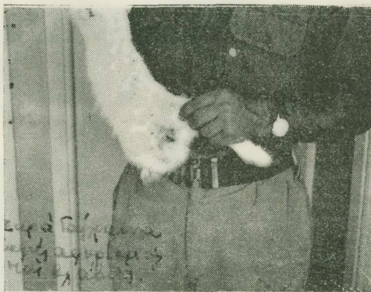
Fig 3.— Gangrène sèche circonscrite.

tisés sont d'une virulence rarement rencontrée. Ces photographies représentent des cas d'orchites phlegmoneuses ou gangréneuses reproduits en série par injection intratesticulaire sur animaux adultes. D'autres lésions sont constituées par des foyers de gangrène locale très caractéristique ou par une tuméfaction énorme du testicule. Il s'en suit une peritonite pseudomembraneuse rapidement mortelle; Si les germes sont moins virulents,