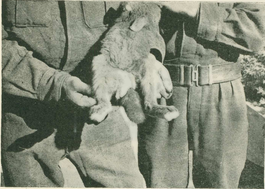
Fig. 1.— Orchite grave abcédifiée.

Nous avons l'honneur de vous présenter des photographies d'animaux porteurs des lésions caractéristiques qui témoignent que les germes exper-