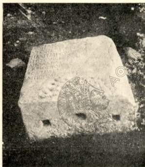
Εἰκ. 7. τῆς Φωτογραφία ἐπιγραφῆς ἀριθ. 8.

Ἐπιγρ. 8 (εἰκ. 7). Μαρμαρίνη στήλη διαστάσεων 0,67X0,55—0,60X0,27 μ. φέρουσα ὅπως καὶ ἡ προηγουμένη ἐπ' ἀμφοτέρων τῶν στενῶν πλευρῶν ἀνὰ τρεῖς τομιάζοντες. Δυστιχῶς μόνον τὸ ἥμισυ τοῦ περιεχομένου τῆς ἐπιγραφῆς σφύζεται, τοῦ ἄλλου τριφθέντος κατὰ τὴν χρῆσιν τοῦ λίθου ὡς κατωφλίον προφανῶς τοῦ παλαιοχριστιανικοῦ ναοῦ. Ὑψος γραμμ. 0,03 μ.—0,06 μ.