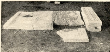
Εἰκ. 5. Παλαιοχριστιανικὰ θεωράκια καὶ πεσσίς ἐκ τοῦ σημείου Ε τῆς εἰκόνας 1 προερχόμενα. Ὁ πεσσίς διατηρεῖ τὸν σιδηροῦν σύνδεσμον τῆς βάσεώς του καθὼς καὶ τὴν σφαιρικὴν ἀπόφυσιν τοῦ ἄνω, ἡ ὁποία δυστυχῶς, δὲν φαίνεται εἰς τὴν εἰκόνα.

Κατὰ τὴν πρὸς τὴν Θράκην χάραξιν τῆς ὁδοῦ Καβάλλας—Ξάνθης,