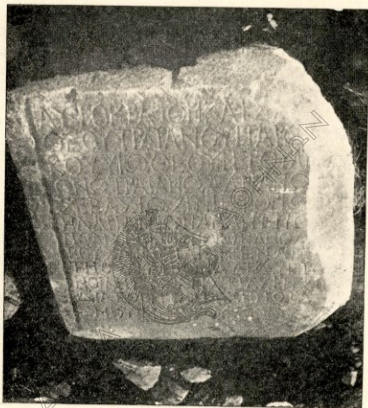
Εἰκ. 6. Φωτογραφία τῆς ἐπιγραφῆς ἀριθ. 7.

ἀνὰ τρεῖς τορμίσκους, ἕως ὅχι συγχρόνους. Ἡ διατήρησις τῆς ἐπιγραφῆς καλή, πλὴν τῆς ἀπολεπισθείσης δεξιᾶς μακροῦς πλευρᾶς της· ὕψος γραμμάτων 0,03—0,05 μ. μεταξὺ δύο ἀνλακωτῶν περιθωρίων κειμένων.