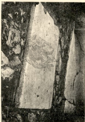
Εἰκ. 3. Ἀναθηματικὴ λατινικὴ ἐπιγραφὴ Heroi Avlonite ἐκ Παραδείσου.

Μαρμαρίνη πλάξ διαστ. 1 μ.×0,69×0,06 χρησιμοποιουμένη ὡς κατώφλιον τῆς οἰκίας Ἀναστασίου Κεντονιάδου ἐν Παραδείσῳ. Τὸ πρόσθιον πλάτος τῆς πλακὸς, ἐφ' οὗ ἡ ἐπιγραφὴ, εἰς ἀπόστασιν 0,17 μ. ἀπὸ τῶν γωνιῶν τῆς ἐλαττοῦται κατὰ 0,02 μ. εἰς τρόπον ὥστε νὰ σχηματίζωνται εἰς τὰ ἄκρα τῆς δύο πόδια. Ἡ ἄνω ἐπιφάνεια τῆς πλακὸς εἶναι τριμμένη ἐκ τῆς σημερινῆς χρήσεως τῆς· ὕψος γραμμ. 0,04 μ.