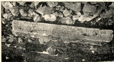
Εἰκὼν 8. Φωτογραφία τοῦ ἐκ τοῦ χωρίου Σερμας (π.ρ. Kourou-deré) Ἐπιγραφῆς ἀριθ. 9.

Τὸ θρακικὸν κύριον ὄνομα Ζυκούλησης δὲν εἶναι ἄλλοθεν τοῦλάχιστον εἰς ἡμᾶς γνωστόν, δὲν ἔχομεν δὲ δυστυχῶς ἐνταῦθα τὸ Namenbuch τοῦ Preisigke. Ἴσως νὰ μὴ εἶναι ἄσχετον τὸ ὄνομα καὶ νὰ δύναται νὰ συγκριθῇ πρὸς τὰ: Σέκου, Σα(ι)κου, Secus, Zeces, Σῦκος («Θρακικά» Δ' σ. 88) πρ. καὶ τὸ β' συνθετικὸν τῶν κυρίων ὀνομάτων Ἐπίησου, Ριμήσου, Δεντούσου (Dobrusky, Isvestia σ. 132) καὶ τοῦ λατινοῦ Como-sicus (Collart BCH. LIV, 1930 σ. 373, 391, Tomaschek II 2, 41, 42, 43, Perdrizet BCH XXIV, 1900, σ. 310 κ. ἐξ.). Ἐκ τοῦ Sicus=Σῦκος=Σέκου