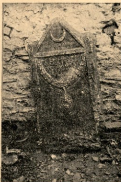
Εἰκ. 2. Ἑπιτύμβια ἐπιγραφή ἐκ Παραδείσου.

Ὡς πρὸς τὴν γνώμην δὲ τοῦ ἐγγράφου τῆς Ἑταιρείας, ὅτι ἡ ἐπιγραφή εἶναι χαραγμένη ἐπὶ ἀρχαίου τάφου, ἔχομεν νὰ προσθέσωμεν, ὅτι μᾶλλον ἀναθηματικὸν χαρακτῆρα ἔχει παρὰ ἐπιτύμβιον, καὶ ὅτι τὸ ὡς τάφος χαρακτηρισθὲν ἀρχαῖον, ἴσως νὰ ἦτο βῆθρον τι ἢ ἄλλο κατασκευάσμα ἀναθηματικόν 1) .