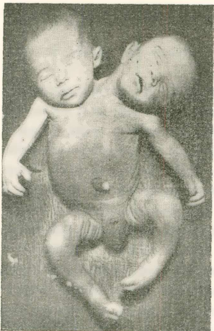
Εἰκ. 1. - Δικέφαλον (ἀνατομικῶς δίσωμον) τέρας. Πρώτη περίπτωσις καθηγ. Γ. Κάτσα.