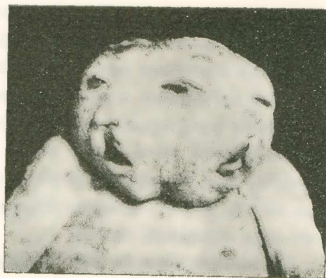
Εἰκ. 4. - Δικέφαλον, διπρόσωπον, τριόφθαλμον (ἀνατομικῶς δίσωμον) τέρας. (Περίπτωσις καθηγ. Γ. Κοσμετάτου).