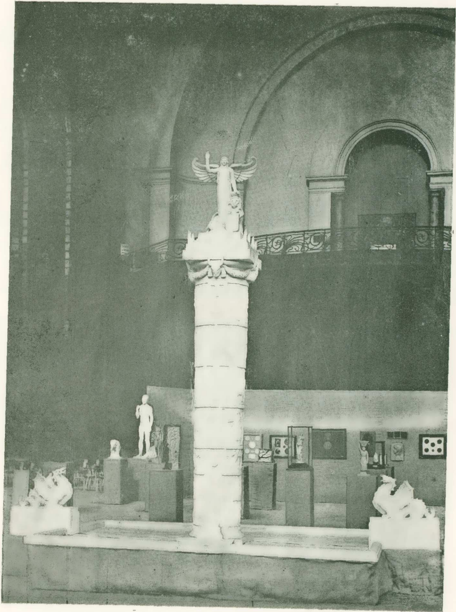
Ἡ Κρήτη, βομός της Ἐλευθερίας (πρόπλασμα τοῦ μνημείου).