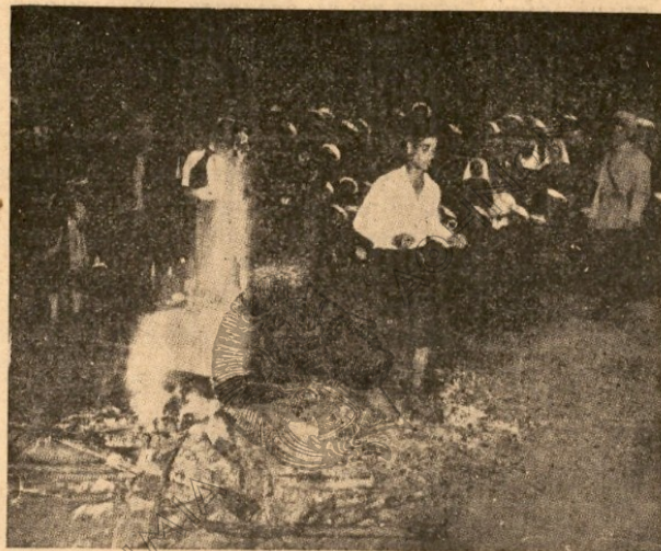
Νέος ἐκ τοῦ χωρίου Βοὺ λ γ ᾱ ρ ἰ ἐν ἐκταστικῇ νατασά- σει, χορευτῶν ἐντὸς τῆς πυρᾶς καὶ παραμείνας ἐντελῶς ἀβλα- βῆς. (Ἐκ τῆς Γαλλικῆς »Illustration» 2 Ἰουνίου 1939).

Ὅταν ἐσκοτείνιασεν ἐντελῶς, ὁ χορὸς ἐπλησίασε τὸν σωρὸν τῶν ξύλων χωρὶς νὰ διακοπῇ διόλου, ἀλλ' ἐπίσης χωρὶς νὰ δείξῃ κανεὶς ἐκ τῶν χορευτῶν οἰονδήποτε σημεῖον ὑστερικής ταροχῆς. Καὶ ἔξαφνα ἡ μουσικὴ ἐσταμάτησε. Εἶχε φθάσῃ ἡ σιγὴ μὴ ν' ἀναφθῇ ἡ πυρὰ. Οἱ παπᾶδες, συνοδευόμενοι ἀπὸ τοὺς κρατύντας τὰς εἰκόνας,