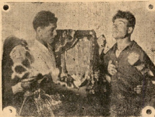
Ἐκστατική (κατατονική) κατὰστασις νέου ἐκ τοῦ χωρίου Βούλγαρι τῆς Βουλγαρικῆς Ἀν. Ρωμυλίας (παρατηρητέον τὴν καθαρῶς Ἑλληνικὴν φυσιογνωμίαν τῶν 2 νέων)

λογίας. Ὅ,τι διαφέρει ὅμως ἡμᾶς εἰς τὴν παροῦσαν μελέτην, εἶναι ἢ ἄνευ οὐδεμιᾶς ἐξαιρέσεως, ἐμφάνεις αὐτῆς εἰς ὅλα τὰ ἀρχαῖα καὶ σύγχρονα μυστήρια. Ἀπὸ τῶν «μαγικῶν» τελετῶν τῶν μάγων (μέντιουμ) τῶν ἀπολιτίσιων φυλῶν, μέχρι τῶν Πυθίων τῶν μαντείων, τῶν Δορυσιακῶν καὶ ἄλλων μυστηρίων τῆς ἀχαιότητος, τῶν «μαγικῶν» τελετῶν καὶ ἐπικλήσεων τοῦ μεσαίωνα, μέχρι τῶν ἐκστατικῶν κατὰστασιν τῶν ἁρίων καὶ ἀσκητῶν (Ἁγ. Φραγκίσκος τῆς Ἀσσίζης, Ἁγία Θηρεσία, Ἅγιος Ἀλφόνσος τῆς Liguori, Ἅγιος Φραγκίσκος