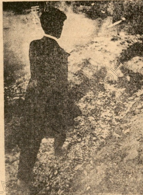
Ὁ Φακίρης Kuda Bux βαδίζων ἐπὶ πειραματικῆς πυρᾶς, ἐν Λονδίῳ κατὰ τὸ 1938

24. Ἀποτελοῦσι δὲ τὰ Ἀναστενάρια τάγμα τι ἰδιαιτερον ἢ ἀδελφότητα, ἀρχηγὸν ἢ μᾶλλον πρόεδρον ἔχουσιν τὸν Ἀρχιαναστενάρην ὅστις ἐκ τῶν τοῦ χωρίου Κωστῆ Ἀναστεναρίων ἐκλέγεται, ἐκ διαδοχῆς τοῦ ἐκαστοῦ πρεσβυτέρου ἢ ἱκανωτέρου. Αὐστηρότερον δὲ καὶ ἀγιώτερον βίον ἐπιδεικνύμενοι, σεβαστοὶ τοῖς πᾶσι γίνονται διὰ καὶ προσερχομένοις αὐτοῖς οἱ καθήμενοι προεξανίστανται καὶ τῆς ὁδοῦ παραχωροῦσι.