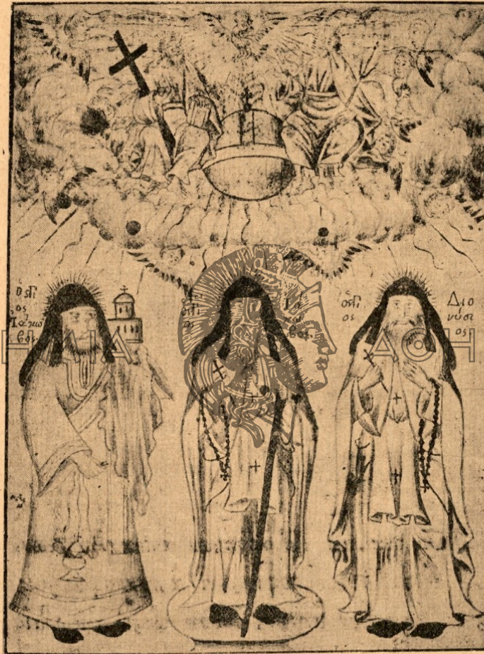
Εἰκόνα στὴν ἀρχὴ τοῦ χειρογράφου.

Τὴ φυλλάδα τὴν τύπωται στὰ 1894 με' ἐξοδα τοῦ διαλυμένου μοναστηρίου τῆς Δερβενίστας σὲ χίλια μονάχα ἀντίτυπα. Οὐτε ἓνα σήμερα δὲν