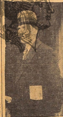
Ὁ πρωτοπόρος τῆς μελισσοκομίας κ. Θ. Μαυσιῶδης κατὰ πρόσφορον φωτογραφίαν τοῦ

φιδοτήτως ἀρκετὰ παραγωγὴν ἀπαχάλασαν τῆς γεωργικῆς οἰκογενείας.