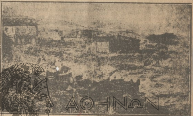
Ο ΔΗΜΙΟΝ ΡΑΙΔΕΣΤΟΝ (Ἰντζέ—Κιοῦ) τῆς ὑποδοκιμήσεως Μυρμιόφτου, μετὰ τὴν καταστροφὴν

ἀκούσει τὴν λέξιν «Ζήτω» καὶ οἱ μισροὶ μὲ τὰς ἐκδηλώσεις τῶν Ἑλλήνων ἐνταῦθα ἔχω πολλὰς ἀναμνήσεις. Πρέπει νὰ ζεῦρητε ὅτι πάντοτε ἐξετίμησα καὶ ἐκτιμῶτεν Ἑλληνικὸν λαὸν διότι εἶναι εὐφύ-