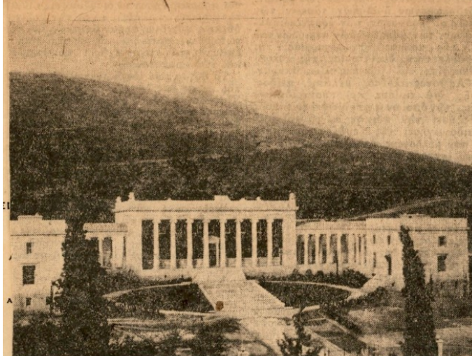
Τό μέγαρον τής Γενναδείου Βιβλιοθήκης