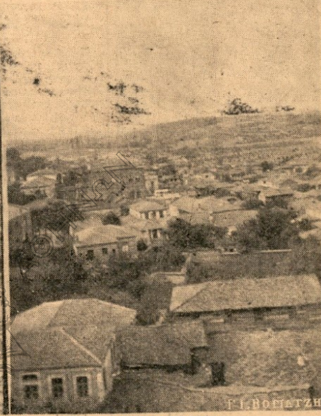
ΑΡΙΣΤΕΡΑ: Ἐνας δρομάκος τοῦ Διδυμοτείχου. — ΔΕΞΙΑ: Ὁ ἔβρος

τους. Ἐμβλημα τους εἶναι ὁπως καί τοῦ κάθε Θρακιώτη ὁ μόχ- θος, ἡ δημιουργία, ἡ δουλειά. Τὴν ὡμορφιά τῆς πόλεως των, τὴ γράφικότητά της, τὰ μνημεῖα της, τὰ κάστρα της δὲν κάθονται νά τὰ χαζεύουν καί νά τὰ θαυ- μάζουν σάν χαζοί, ραφηνარი- σμένοι ἔστέ. Τὰ μνημεῖα ζοῦν τὴ δική τους αἰωνία ζωὴν καί οἱ ἄνθρωποι τὴν ἐφήμερή, ἀλλά τόσο γόνιμη, τόσο μεστή, τόσο γερὴ δική τους ζωή. Κάτω ἀπὸ τὰ αἰωνόβια βυζαντινὰ κάστρα, πού ζέσταναν τίς τάμπιες μέ τὰ στήθη τους οἱ παλαιοὶ βυζαντι- νοὶ ἀπελάτες, κυλάει ὁ βόμβος τῆς σημερινῆς ζωῆς, σάν ἕνα ἐξέλιλο καί πρόσχαρο ποτάμι. Καί κάθε μέρα τὸ ποτάμι αὐτὸ ἔχει νά πῃ κι' ἕνα καινούργιο τραγούδι αἰσιοδοξίας κι' ἐργα- σίας μέ τοῦς φοιστικούς του, κατεβαίνει ν' ἀγκαλιάσῃ και- νούργιες ἐλπίδες.