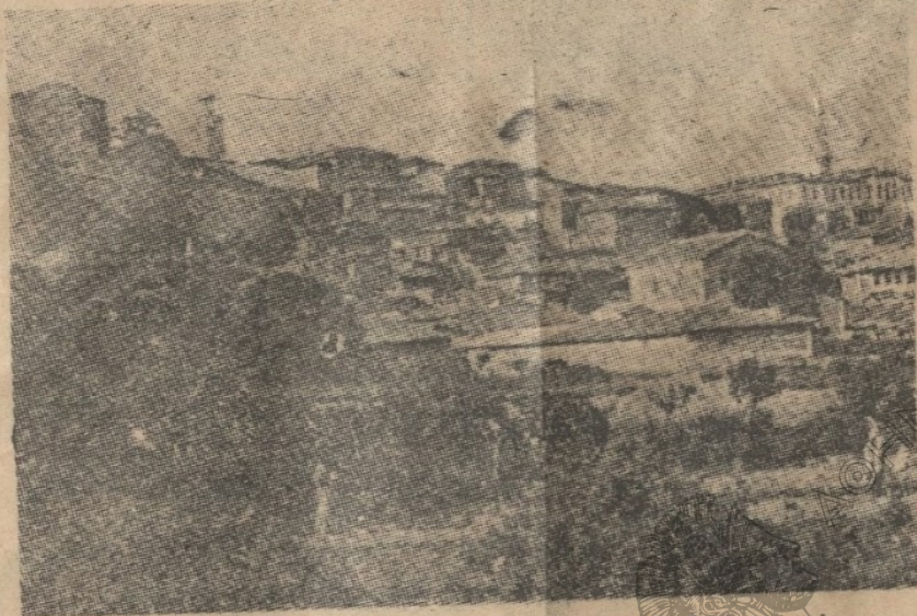
Ἐνα ἀπὸ τὰ γραφικώτερα κομμάτια τοῦ Διδυμοτείου

Ἄμα θέλετε νὰ κάνετε μιὰ γενικὴ ἐπισκόπησι καὶ ἐπιθεώρησι τῶν κατοίκων τοῦ Διδυμοτείου θὰ πᾶτε βράδυ στὸ δρόμο τοῦ σταθμοῦ. Εἶναι ὁ δρόμος τοῦ σταθμοῦ. Ἐκεῖ ὁλόκληρο