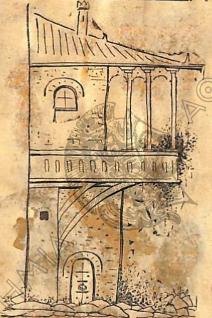
Σπίτι εἰς Μαρωνείαν.

ΚΑΡΟΛ ΛΟΜΠΑΡΝΤ Ἐνα φιλμ γεμᾶτο χιού- ...μορ, πού θὰ σκορηθῇ ἀβί- ...ασα τὸ γέλιο. ΣΗΜΕΡΟΝ