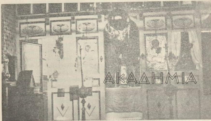
Τὸ ἐσωτερικὸν τοῦ ἱεροῦ ναοῦ (Τέμπλον) εἰς τὸ βάθος τοῦ Ἁγίου Βήματος ὁ ἐπιτάφιος τῆς Ἱερᾶς Σκῆτης καὶ ὁ Τρωάδος Εὐστάθιος.

9.—Ὁ πατὴρ Ἀρσένιος τὴν Θεολογικὴν Σχολὴν διὰ τὴν ἐξομολόγησιν τῶν Ἱεροσπουδαστῶν, κατὰ τὰς ὑπὸ τῆς Ἁγίας ἡμῶν μητρὸς Ὁρθοδόξου Ἐκκλησίας κεκανονισμένας τέσσαρας ἐτησίους Νηστείας ἐπισκεπτόμενος