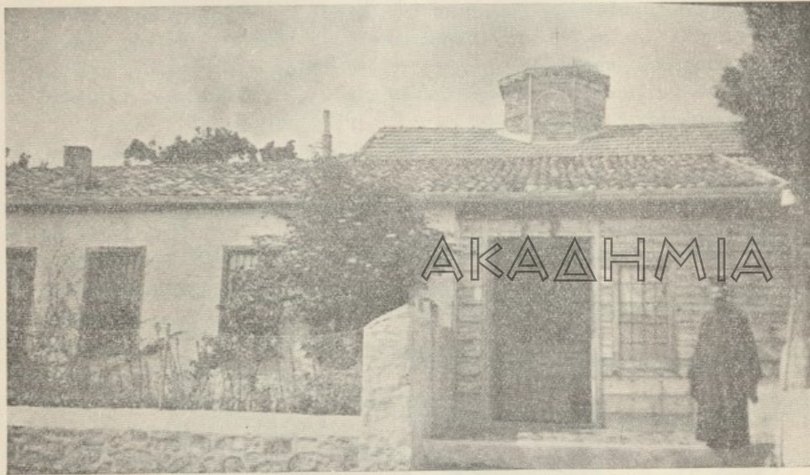
Ἡ κυρία εἴσοδος τῆς ἱερᾶς Σκήτης (μεσημβρινὴ πλευρὰ).

Ἡ μεγάλη ἐθνικὴ καὶ φιλανθρωπικὴ δρασίς καὶ αἱ διαφημιζόμενα πολλὰ χριστιανικὰ ἄρετὰ τοῦ Πνευματικοῦ Εὐστρατίου, τόσο ἐπέδρασαν ἐπὶ τοῦ πνεύματος τοῦ ἐνθουσιώδους διὰ τὴν ἀγγελικὴν πολιτείαν νέου Ἀναστασίου, ὥστε μεταβὰς εἰς Χάλκην ἐν ταπεινώσει καὶ ἑξομολογήσει παρεκάλεισεν τὸν Εὐστράτιον, ὅπως κατατάξῃ καὶ αὐτὸν ἐν τοῖς ὑποτακτικοῖς αὐτοῦ. Ὑπὸ τοῦ Εὐστρατίου δὲ ἐπὶ πενταετίαν ὄλην διαπαιδαγωγούμενος ὄχι μόνον ἐτελειοποιήθη ἐν τῇ Μοναχικῇ ἀσκήσει, ἀλλὰ καὶ ἐπεδόθη εἰς μελέτην ὄλων τῶν Πατερικῶν βιβλίων, τῶν ὁποίων συνήθως χρῆσιν ποιοῦνται οἱ καλοὶ Πνευματικοί.