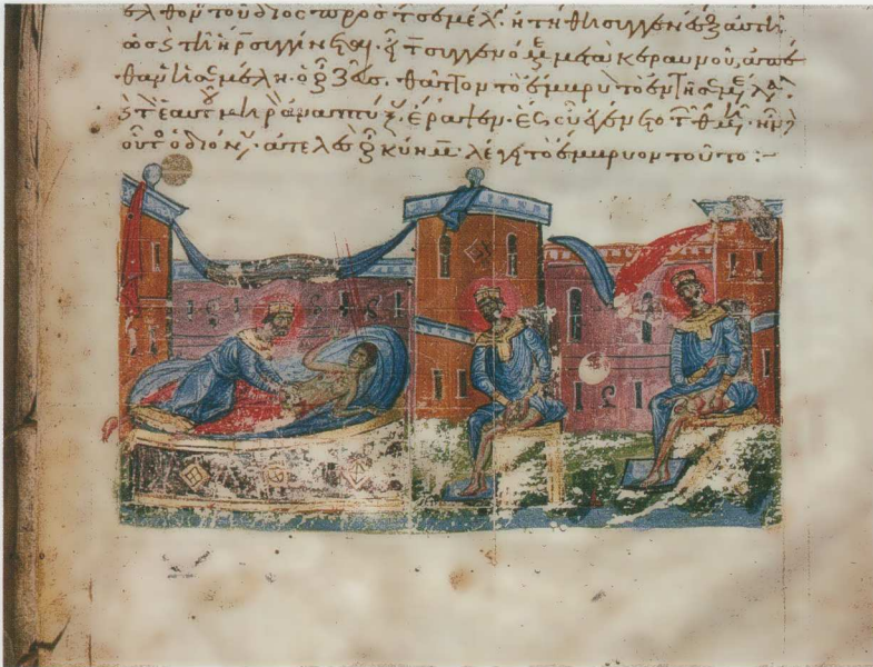
Εἰκ. 17. Λόγοι ἀγ. Γρηγορίου τοῦ Θεολόγου Τάφου 14, φ. 311. Ἡ Γέννηση τοῦ Διονύσου ἀπὸ τὸν μηρὸ τοῦ Διός.