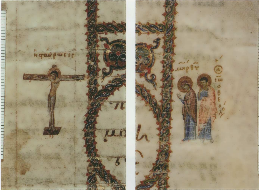
Εικ. 12. Ειλητάριον Σταυροῦ 109. Σταύρωση.