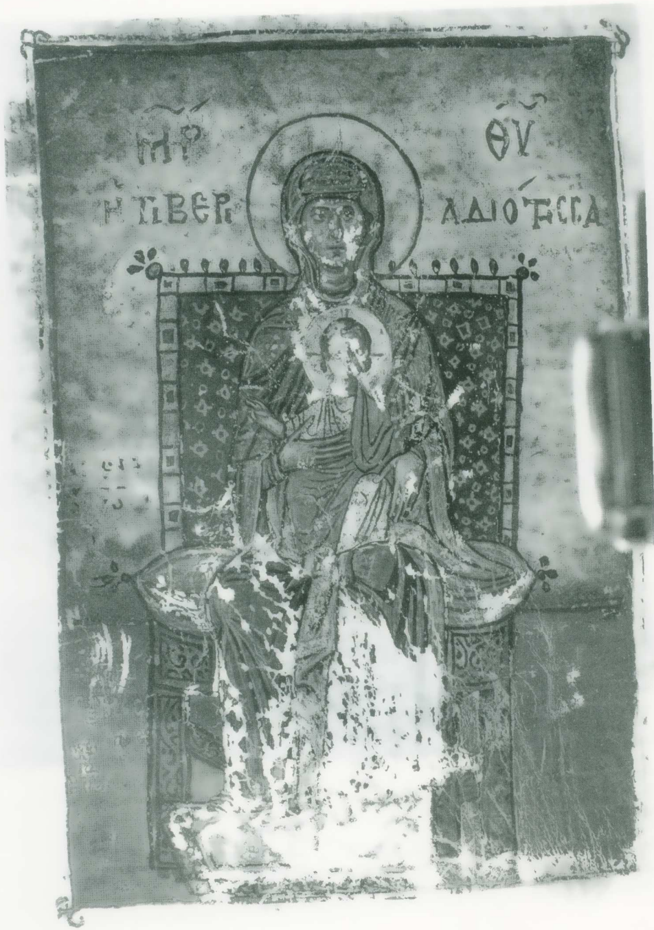
Εικ. 2. Ευαγγελιστάριον Αναστάσεως 9, φ. 150ν. Θεοτόκος Τιβεριδιώτισσα.