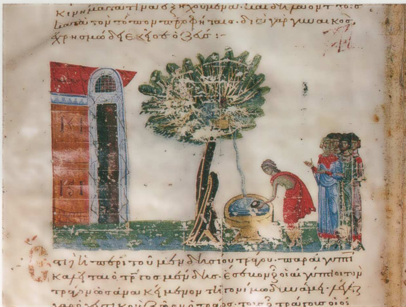
Εἰκ. 18. Λόγοι ἀγ. Γρηγορίου τοῦ Θεολόγου Τάφου 14, φ. 312v. Τὸ ἱερὸ τῆς Δωδώνης.