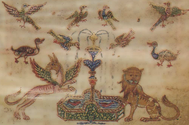
Εἰκ. 19. Γραμματικὴ Τάφου 52, φ. 50. Τέλος τοῦ κεφαλαίου «Περὶ τῶν θηλυκῶν κανόνων».

56 ψλήγορ τω εἴτῳ ἀρσβρικῶ εἰβρῆτε θηλυκαὶ ὡσαύτως κλίμα ταιδία π. ὡς γὰρ τὸ κύκλω ψ κύκλω ποσ ἀρσβρικῶ οὐτῶ καὶ τὸ καλαίμο ψ καλαίμο ποσ θηλυκῶ; ὡβριπτομ ἡγισατῆ περιῶρ θη τοῖσ ἀρσβρικοῖσ ἀρκοῦ τωσ θ δὶ λαξε, πῶρι τῶν αὐ τῶν δαλαμαμειρ πάλιν καὶ θη τοῖσ θηλυκοῖσ: ~