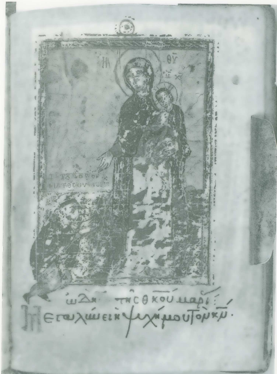
Εἰκ. 3. Ψαλτήριον Τάφου 55, φ. 260. Ἡ Θεοτόκος καὶ ὁ ἀφιερωτῆς μοναχὸς Ματθαῖος.