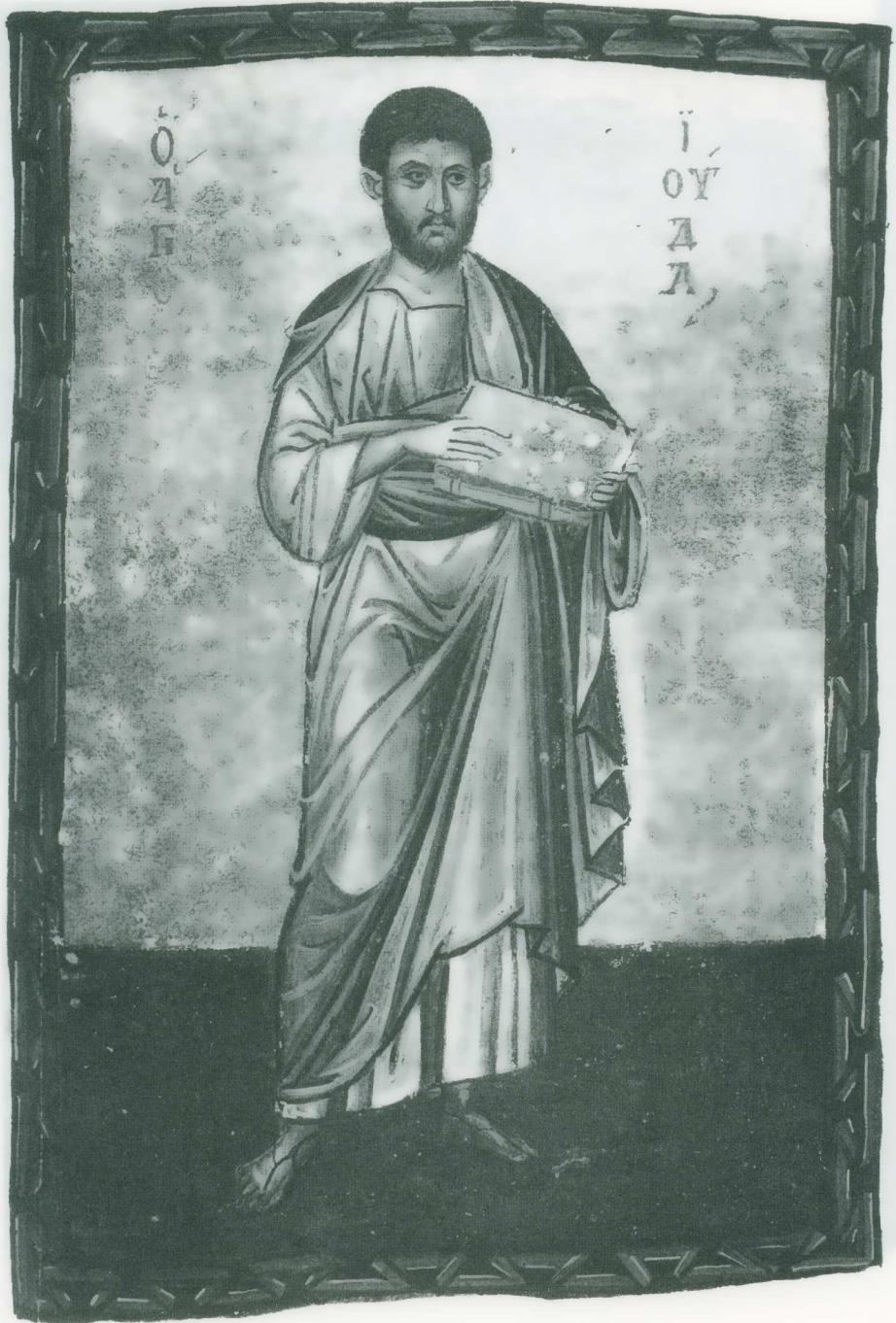
Εικ. 4. Καινή Διαθήκη Τάφου 37, φ. 255v. Ο απόστολος Ιούδας.