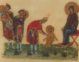
Εικ. 16. Λόγοι ἁγ. Γρηγορίου τοῦ Θεολόγου Τάφου 14, φ. 106ν. Ἰωάννου Εὐβοίας, Λόγος εἰς τὴν Γέννησιν.