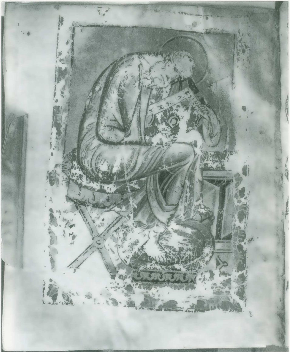
Εικ. 6. Τετραευάγγελον Νέας Συλλογής 28, φ. 178ν. Ο εὐαγγελιστὴς Ἰωάννης.