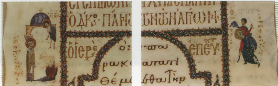
Εικ. 13. Ειλητάριον Σταυροῦ 109. Ὅραμα καὶ Αποτομή τοῦ ἁγίου Πέτρου Ἀλεξανδρείας.