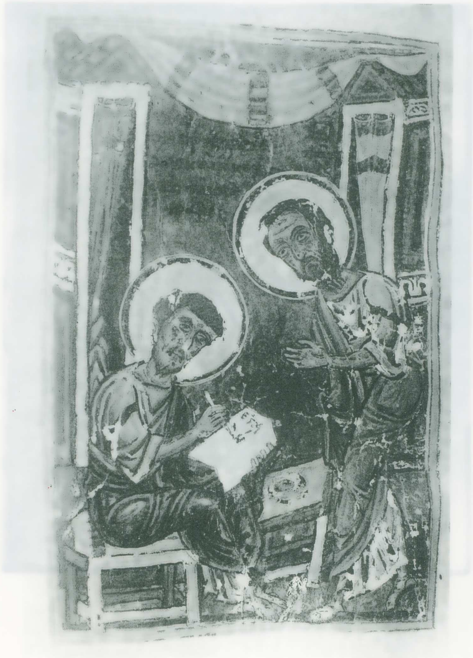
Εικ. 5. Τετραεὐάγγελον Τάφου 56, φ. 105ν. Ὁ ἀπόστολος Παῦλος ὑπαγορεύει στόν εὐαγγελιστή Λουκά (Hatch).