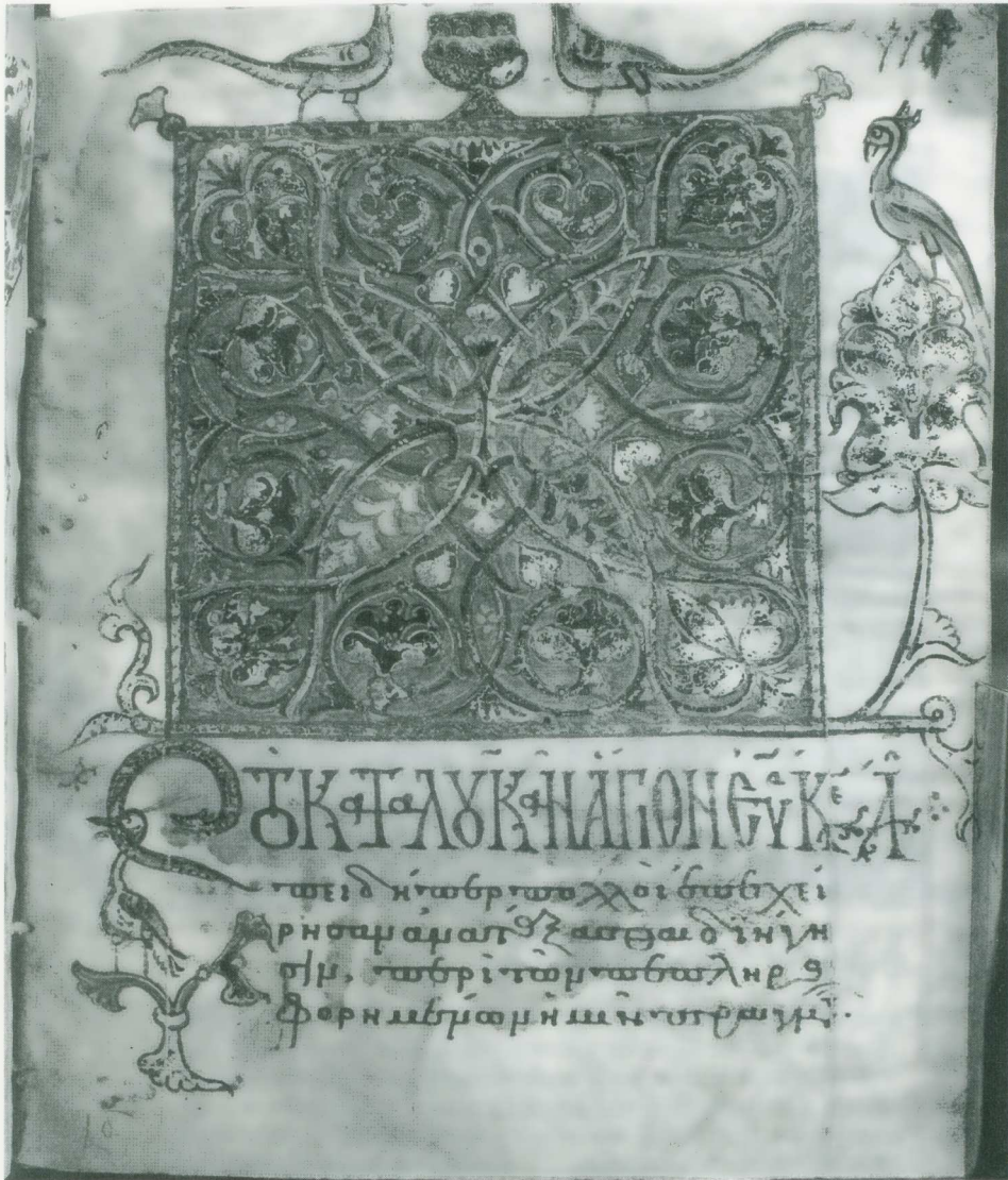
Εικ. 7. Τετραεὐάγγελον Νέας Συλλογῆς 28, φ. 111. Επὶ τίτλο τοῦ κατὰ Λουκᾶν εὐαγγελίου.