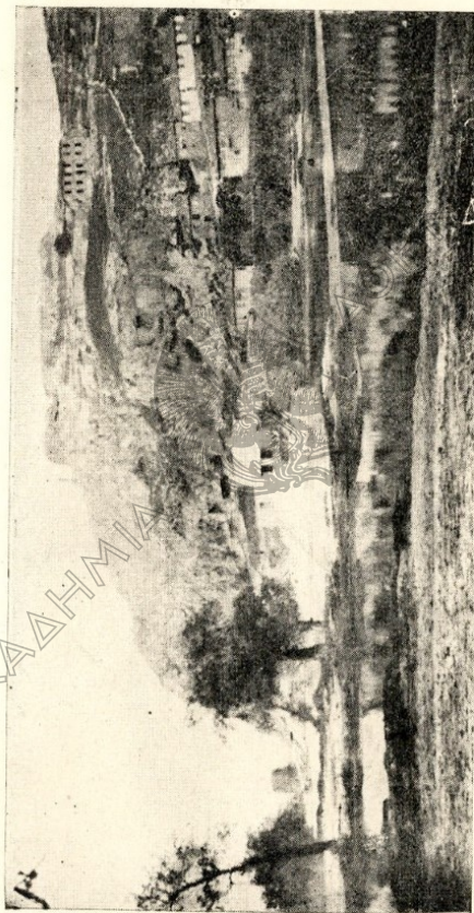
Ἀνω δεξιὰ, ὁ κατεδαφισθεὶς παλαιὸς ξενών, ὅπουθεν αὐτοῦ δυσδιόρατος ὁ ναὸς καὶ τὸ «Παλαιὸ». Ἀριστερὰ μετὰ τῶν δένδρων, εἰς τὸ βάθος ὁ πύργος «Πεντάγωνον» (Μπέζ-κούσακ).

Τὸ Μοναστήριον, ἐπειδὴ εἶχεν ἀνάγκην, ἐπιδιωρθώθη, ὡς ἔλεγεν ὁ Παπαζιάν, καὶ τὸ 1896 περίπου. Μετὰ ταῦτα ὁμοῦς ἡρειπώθη