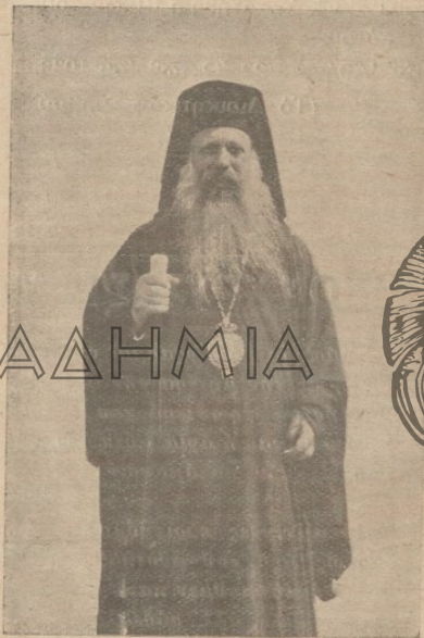
† Ὁ Ἀθηνῶν Χρυσόστομος

πλοῦς καὶ ταπεινῶρων. Τὸν ἐγνώρισα, ὅταν ἦδη ἐμεσουράνει εἰς τὸν ἐπιστημονικὸν τοῦ ὀρίζοντα καὶ ἡ πρώτη μου ἐντύπωσις, ἥτις δὲν μετεβλήθη ποτὲ μέχρι τῶν τελευταίων τοῦ σιγμῶν, καθ' ὅς ἠτύχησα νὰ ἀσπασθῶ τὴν χεῖρα του, ἦτο ἡ τῆς ἀπλότητος καὶ ταπεινοφροσύνης ἀνθρώπου δυναμένου νὰ ἐπιδείξῃ καρπὸς πραγματικῶν βιωτικῶν κόπων εἰς τὴν, θέσει, εἰς ἣν ἔταξεν αὐτὸν ἡ Θεία Πρόνοια.