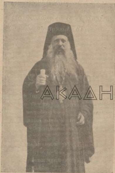
† Ὁ Ἀθηνῶν Χρυσόστομος

πλοῦς καὶ ταπεινῶρων. Τὸν ἐγνώρισα, ὅταν ἦδη ἔμεσουράνει εἰς τὸν ἐπιστημονικὸν τοῦ ὀρίζοντα καὶ ἡ πρώτη μου ἐντύπωσις, ἥτις δὲν μετεβλήθη ποτὲ μέχρι τῶν τελευταίων τοῦ σιγμῶν, καθ' ἃς ἠτύχησα νὰ ἀσπασθῶ τὴν χεῖρα του, ἦτο ἡ τῆς ἀπλότης καὶ ταπεινοφροσύνης ἀνθρώπου δυναμένου νὰ ἐπιδείξη καρκὸς πραγματικῶν βιωτικῶν κόπων εἰς τὴν, θέσει, εἰς ἣν ἔταξεν αὐτὸν ἡ Θεῖα Πρόνοια.