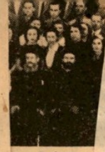
προεδρίαν τοῦ ὄν δημοδιδασκῶν μετασχόντες σπειρὰν μεταξὺ τῶν Λοκαδαίμων παγιαννάκος σπείρας Ε' ἐκπαιδευτικῆς.

Ἔθνικῆς μας νομὸν ἀπὸ σήμερον ἀπληραγμένον; δηλώσεις τοῦ ἡγετῆος Διοικήσεως ἡρωστικῶν ἀποστολικῶν εἰς ἡμετέρας ἐπισημοσύνας. Ζητήματα σὰς εἰς διότι ἐχω πρὸς τὰ στάδιον τῆς ἐκπαίδευσης, ὑποχρεωτικὰ ἔργα, ἡθικὴ πρόνοια, ἀθλητισμὸς, ψυχολογία τῶν ὁρίων, ἀλλὰ καὶ τὰ ἄλλα, ἃ θὰ μᾶς ἀποσπορίσῃ, καὶ συντόμως ἐπιθυμοῦμεν νὰ σὰς ἐκπαιδεύσῃτε πρὸς τὸ πρόγραμμα, τὸ ἐπισημοσύνη πιστῶς ἢ νέα Δημοτική.