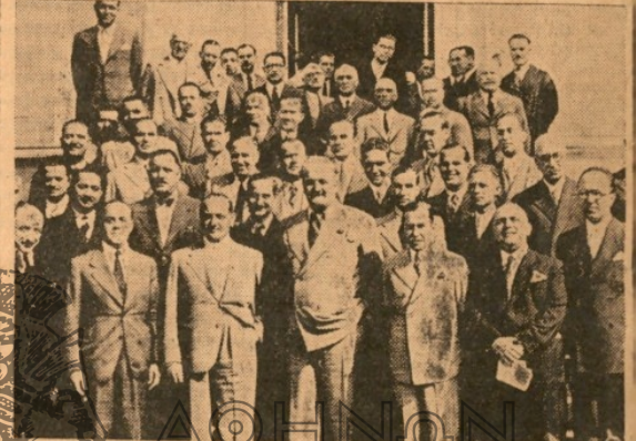
Μετά τήν χθεσινήν όρκωμοσίαν των νέων δημοτικών συμβούλων, ό Ύπουργός Διοικήτης τής Πρωτεύουσας κ. Κ. Κοτζιάς έφωτογραφήθη μετ' αυτών. Εις τήν πρώτην σειράν ό κ. Κοτζιάς και ό Δήμαρχος Αθηναίων κ. Πλυτάς μετ' των νέων Δημάρχων. Όπισθεν τά μέλη των δημοτικών συμβουλίων.

Οι νέοι Δημοτικοί και Κοινοτικοί Άρχοντες μίαν έχουν Ιερών φιλοδοξιών: Να αποδειχθώσιν άντάξιοι των