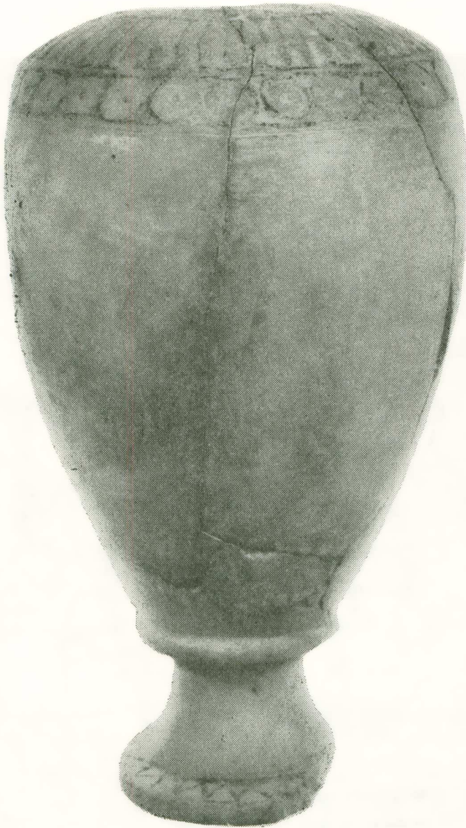
3. Ἀλαβάστρινο ἀγγεῖο ἀπὸ τὴν Πύλα - Κοκκινόβερο.

Ἐνα «κυκλώπειο» τεῖχος, κτισμένο στὴ βάση τοῦ ἀκρωτηρίου, τὸ προστάτευε ἀπὸ τὴν ξηρά, ἐνῶ ἕνα δεύτερο τεῖχος στὸ σημεῖο ὅπου ἡ ξηρὰ χαμηλώνει ὀμαλὰ ὠς