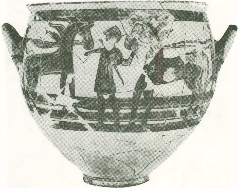
2. Μυκηναϊκὸς III B κρατήρας ἀπὸ τὴν Πύλα - Κοκκινόκρεμο.

νόκρεμο δὲν βρέθηκε οὔτε ἓνα ὄστρακο τῆς Μυκηναϊκῆς IIIΓ: 1β κεραμεικῆς μποροῦμε νὰ χρονολογήσουμε τὸν οἰκισμὸ αὐτὸ λίγο πρὶν ἀπὸ τὸ 1200 π.Χ., πιδ συγκεκριμένα ἀπὸ τὸ 1230 μέχρι τὸ 1200 π.Χ. Ὁ οἰκισμὸς ἐγκαταλείφθηκε ἀπότομα σὰν ἀποτέλεσμα ξαφνικῆς καταστροφῆς. Ὁ μεταλλουργὸς ἔθαψε κομμάτια ταλάντων χαλκοῦ καὶ μερικὰ ἐργαλεῖα του καὶ σκεύη σὲ λάκκο κάποιας αὐλῆς, ὁ ἀργυροχόος ἔκρυψε