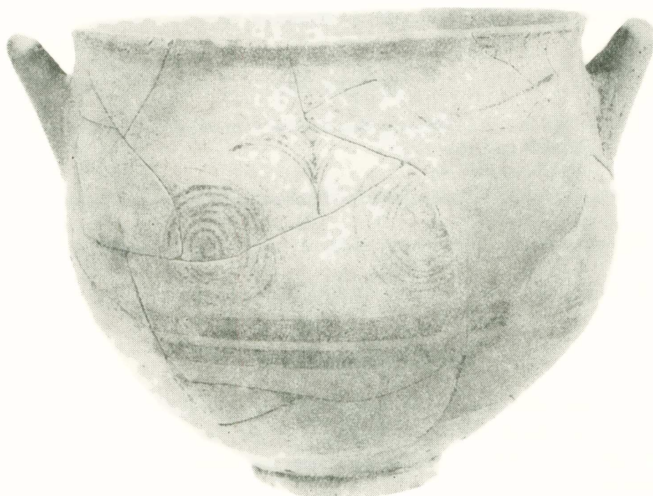
5. Μυκηναϊκός ΙΙΙΓ: 1β σκύφος από την Μάα - Παλαιόκαστρο.

πηγές γνωρίζουμε ότι κύματα από τυχοδιώκτες ποικίλης προέλευσης μάστιζαν τις άκτες τής ανατολικής Μεσογείου. Μερικοί από αυτούς είχαν ίσως εγκατασταθεί στην Κύπρο. Άλλοι ήττήθηκαν από τους Αίγυπτίους και άλλοι εγκαταστάθηκαν στην Παλαιστίνη, όπου είναι γνωστοί σαν «Φιλισταίοι». Αυτοί οι τυχοδιώκτες που μπορούμε να αποκαλούμε «Λαούς τής Θάλασσας» όπως αναφέρονται στις αϊγυπτιακές πηγές, ήταν ίσως εκείνοι που δημιούργησαν τον πρώτο οικισμό στη Μάα-Παλαιόκαστρο και την πρώτη εγκατάσταση στην Πύλα-Κοκκινόκρεμο γύρω στα 1230 π.Χ. Λίγο άργότερα, γύρω στα 1200 π.Χ. ένα νέο κύμα προσφύγων από το Αίγαίο