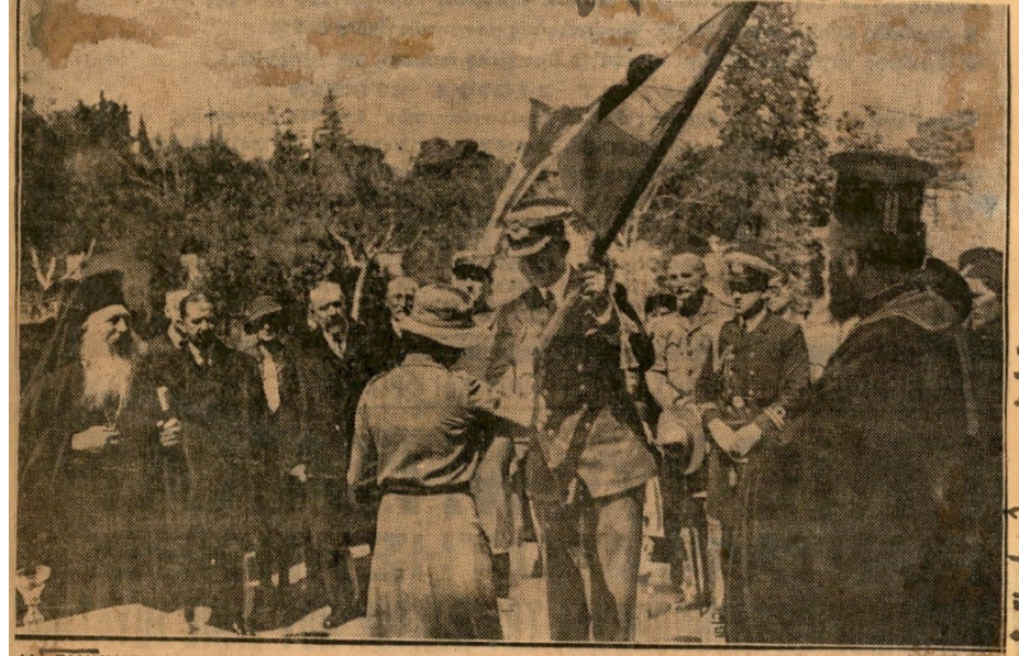
ΑΙ ΈΛΛΗΝΙΔΕΣ ΠΡΟΣΚΟΠΙΝΕΣ: Είς τήν προσάλιον του Αμολιείου Όρφανοτροφείου έγένετο χθές τήν πρώταν μετά πάσης έπισημότητος ή τελετή της έπίδοσεως της σημαίας υπό της Α. Β. Υ. του Διαδόχου Παύλου εις τήν «Σώμα Έλληνίδων Όδηγών» (πυροσκόπων). Μετά τήν τελεσιν του άγιασμού, ο άδοχος παρέδωκε τήν σημαίαν, άκολούθως δέ ανεγνώσθη ημερησια διάταξη προς τάς Έλληνίδας οδηγούς, διά της όποιας έξήρθη ή συμβολική σημασία της σημαίας. Είς τήν φωτογραφίαν, καθ' ήν στιγμήν ο Διαδόχος παραδίδει τήν σημαίαν εις τήν άρχηγόν των Έλληνίδων οδηγών.