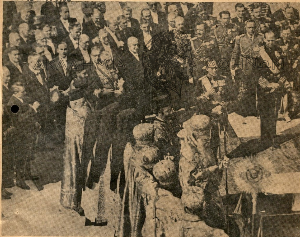
Ο Βασιλεύς, ο Διάδοχος, ο πρόεδρος της Βουλής κ. Σοφούλης, οι ύπουργοι και οι λοιποί επίσημοι παρακολουθούν εν καταύξει την ψαλλομένην πρό τοῦ μνημείου τοῦ ἀγνώστου στρατιώτου ἐπιμνημόσυνον δέησιν ὑπὲρ τῶν ἡρωϊκῶς ἀγωνισθέντων καὶ πεσόντων ὑπὲρ τῆς πατρίδος. Λεπτομερῆ περιγραφὴν τοῦ μνημοσύνου δημοσιεύομεν εἰς τὴν 5ην σελίδα