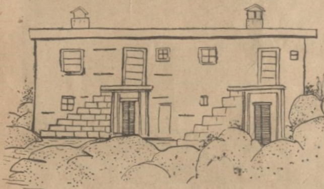
Αί περίφημοι παλαιά διπλοκατοικία της Χώρας Σαμοθράκης.

Ξην, άπατηθέντα, να αναφωνήσῃ τό γνωστόν : — Αί μέν γυναίκες έγιναν άνδρες, και οι άνδρες έγιναν γυναίκες.