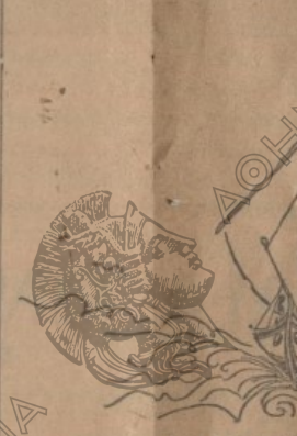
Άλιγη όρεσιά από την 'Αλεξανδρουπόλιν

"Ήταν ο Έξοδάκτυλος του έλληνικού Έπιτελείου. Γνωστές του, από τον άγώνα, γιατι όπτηρέσαν ως... δάσκαλος, στο προξενείο της Θεσσαλονίκης. Γνωστός, άλλ... άναπαύτετος. Μετά την τρικυμία της γαργας της έκπληξας το βρόντημα. Μεγάλες ημέρες συγκινήσαν.