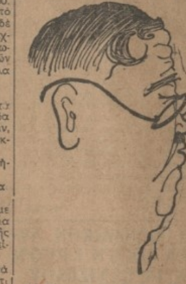
Ο δήμαρχος 'Αλεξανδρουπόλεως κ. Κουτοβέλλη.

Τό έδαφος εινε πολύ έλδωδες και ή όπιδήρησις άδύνατος. Με καλά λεωφορεία, το λοιπόν, την έπιόλεψιν και όργάνωσιν ή-