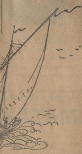
Άλιγη όρεσιά από την 'Αλεξανδρουπόλιν

της άμετακινήτου θελήσεως του λαού, όπερ της μεταφοράς των, και της βαθείας πεποιθήσεως του, ότι δι' αυτών όχι μόνον θα σωθθ ή πόλις, αλλά και θα ευτηχισθ κινδυνεύει να γινή ζήτημα δημοσίας τάσεως έξω.