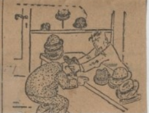
... Ένα καθ' έκάστην

... Και ο Μπιάνκι άμέσως: — Αούτος όμως τούς πίνακες δέν πρέπει ούτε νά τούς άρχίζω μεν.