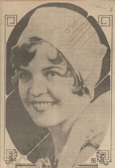
Η Δέμα Κάδρον Κάρο, η όποιαν έβελήθη δια την καλλοίαν της αυτοειδικίας των Ανατολικών κωνογέμων εν τη Όσθην, της Πολιτείας Ρουσίας.

Και τούτο για να άνακουρισθούσι οι πληθυσμοί, καταδικάζονται με τας εις την Κομοτινή συνάξαι και άδικαιώτως μεταβάσει των. Είς 6.000.000 έγουν υπολογισθή