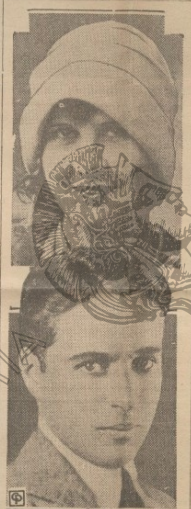
Ο Τσούλι Τσούλι, κάποιος και η πόλις σφάζει τον, ήνω, ποι των άποσιν έσθλιος διαδίδει ότι πρόκειται να σφάζωμεν εν ποία.

περιπτώσις άδυνάτου συστάσεως Νομαρχίας έκει πέρα.