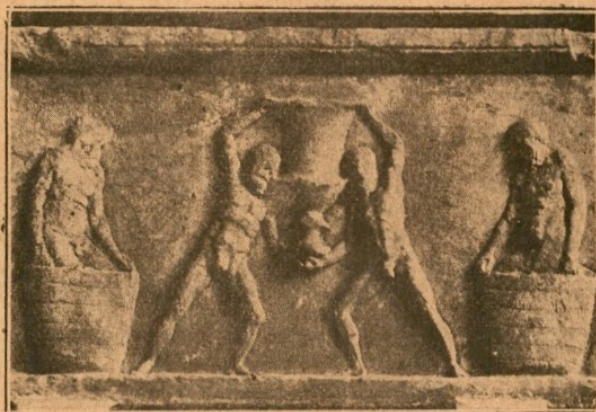
Τὸ ἀνάγλυφον τῶν σείληνων.

Κοντὰ εἰς αὐτὰ ἐπῆραν θέσεις καί διάφορα νεώτερα εἰρημικά, τὰ ὁποῖα δέν εἶνε ἐπαρκῶς γνωστά εἰς τὸ κοινόν. Μεταξὺ τῶν ἄλλων ἀνάγλυφον θαυμαστῆς τέχνης τῶν χρόνων τοῦ Ἀδριανοῦ, εὐρεθέν παρὰ τὸ Χαλάνδρι καί εἰς τὸ ὁποῖον παριστᾶται ὁ Διόνυσος κρατῶν κἀνθάρον καὶ θύρσον, μικρὰ ἀνάγλυφος κεφαλὴ γυναικὸς ἀρίστης ἀρχαϊκῆς τέχνης, μαρμάρηνον ἀγαλμάτιον παριστῶντὸν θάνατον, ὡς νέον ἐστεμμένον καί