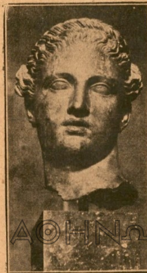
Ἡ χαλκὴ κεφαλὴ τῆς Περσέως.

ἀνάγλυφους παραστάσεις. Ἐξ αὐτῶν ἡ πρώτη ἀναπαριστᾷ σειληνοὺς, πατώντας ἐντὸς κάδων σφαυρίας. Ὄταν τὴν ἀντιοχρῆσιν κανεῖς, νομίζει δὲ βλέπει ἀναπαράστασιν τοῦ σημερινοῦ τρύγου, ἢ μᾶλλον τὸν τρύγον δωρῶς ἐγίνετο εἰς τὰ χωριά τῆς Ἀττικῆς, ποὺ παράγουσιν κρασί, ἄριν ὀλίγα ἀ-