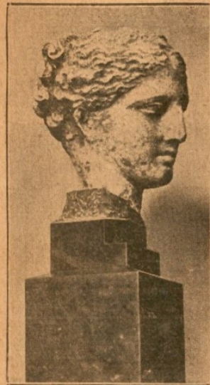
Ἡ κεφαλὴ τῆς θεᾶς Ὑγείας.