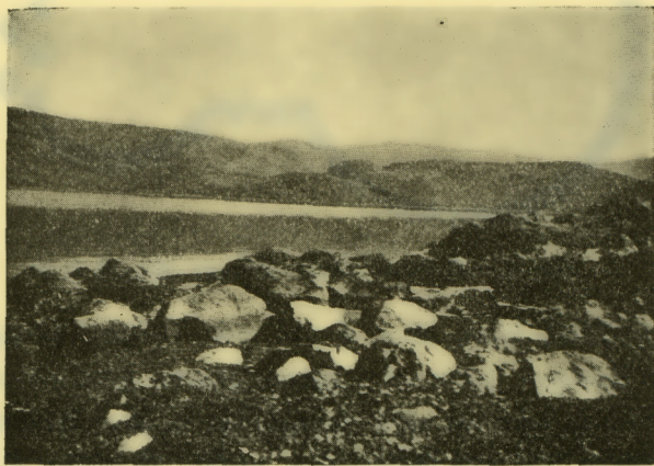
Εἰκ. 2. — Ἡ νοτιὰ ὄψις τῆς λίμνης ὅπου οἱ τάφοι.

Εἰς τὰ κράσπεδα δὲ τοῦ λόφου παρὰ τὰς ὄχθας τῆς λίμνης εὔρομεν ἐκτὸς πλήθους ἄλλων ὀστράκων ἐκ προϊστορικῶν ἀγγείων καὶ ἐν ὀλόκληρον, ἐντὸς τῆς ἄμμου, χειροποίητον ἀγγεῖον μετὰ ἐρυθροῦ γανώματος, ἀνήκον ἀσφαλῶς εἰς τὴν πρωτοελλαδικὴν περίοδον 3 . Προσεκτικωτέρα ἔρευνα, ἄνευ τινος σκαφῆς, ἀπεκάλυψεν ἡμῖν τὴν ὑπαρξῆν μεγάλου προϊστορικοῦ νεκροταφείου, οὗ οἱ τάφοι εἶναι ἄλλοι μὲν κιβωτόσχημοι, ὡς οἱ ἀνωτέρω ἀναφερθέντες, ἄλλοι δὲ κυκλοτερεῖς λαξευτοὶ ἐντὸς τοῦ μαλακοῦ λίθου, παρόμοιοι, ὡς ἐξωτερικῶς φαίνονται, πρὸς τοὺς παρὰ τὴν Χαλιίδα ἀνακαλυφθέντας 4 . Ἀποτελοῦνται δηλ. ἐκ δύο μερῶν, ἐξ ἑνὸς ἡμικυκλικοῦ θαλάμου (ἐνὸς τούτων ἡ διάμετρος ἦτο 2 περίπου μέτρων) καὶ ἐνὸς μικροῦ θαλαμίσκου κεκαλυμμένου κατὰ τὴν εἴσοδον διὰ πετρῶν. Εἰκ. 3. Τάφους παρατηρεῖ τις καὶ ἐντὸς τῆς λίμνης, ἀρκούντως ἀξυθηθείσης ἐκ τῶν διοχετευθέντων ὑδάτων τῆς ἀποξηρανθείσης Κω-