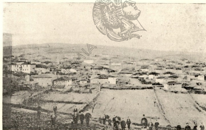
Τὸ χωρίον Ἀκ ἁλάν Ἀδριανουπόλεως.