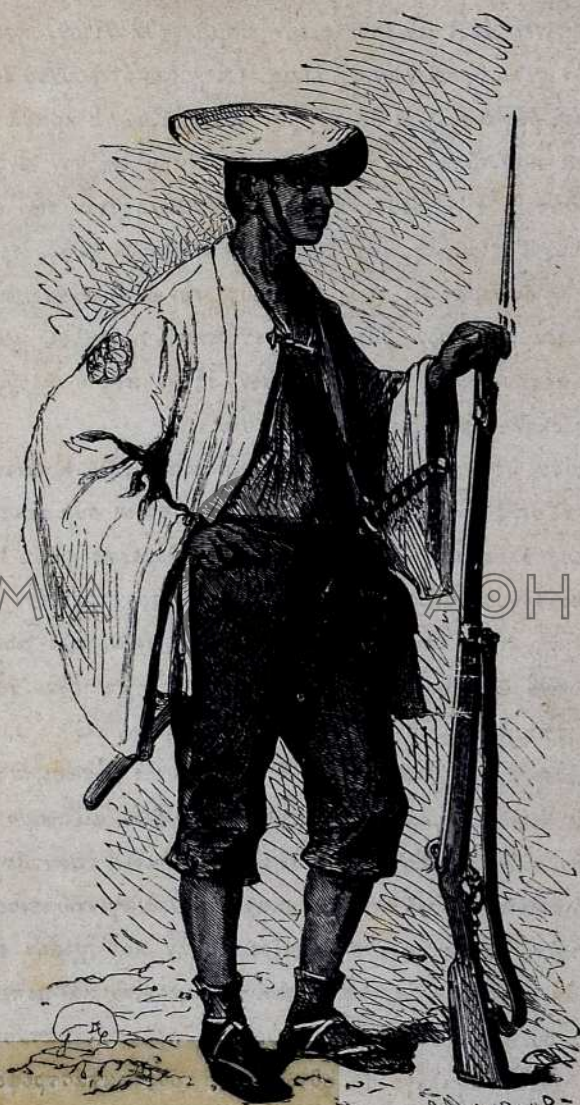
ΣΤΡΑΤΟΣ ΤΗΣ ΙΟΝΙΑΣ. — Στολή του πεζικού.