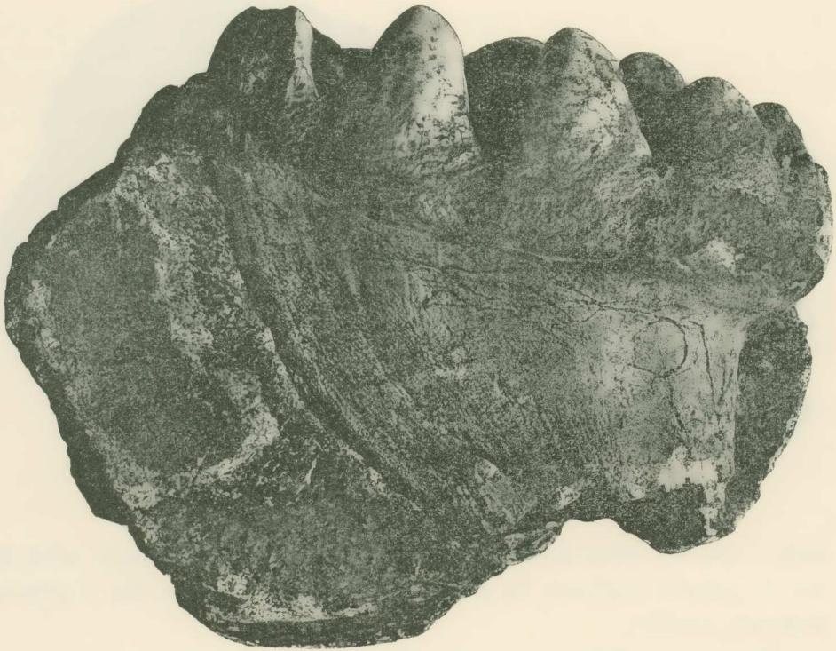
Abb. 2. Dasselbe Mandibelsstück seitlich von innen gesehen.

Von den Wurzeln (Abb. 2) ist nur der mächtige, nach rückwärts leicht