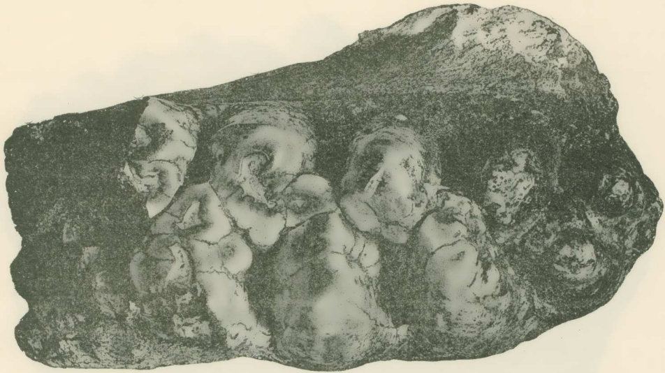
Abb. 1. Unterkieferrest mit M_3 dext. von der Kaufläche. (Wiedergabe: \frac{2}{13} natürl. Grösse)

Die Täler sind innen völlig gesperrt und aussen offen. Man muss hierbei bemerken, dass das I äussere Tal, obwohl es regelmässig von der Spitzenregion der zwei ersten (I und II) prätriten Halbjoche beginnt, den-