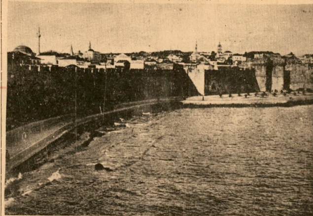
Αποψις του λημέρος της Ρόδου.

λος, ενώ τώρκα.) και μέ την κυανέλευκεν στολήν του έρχιντο εις τούς δακρυόντας Έλληνες ως άγγελος κατ'έας εκ τού ύψους κυανέυ έρραχυν έκταλήν του Μεγάλου της Ελλάδος Θεού διασηνέωση εις άπας αν