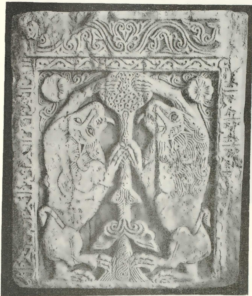
Εἰκ. 5 — Βυζαντινὸν θωράκιον μετὰ κουφικῶν ἐπιγραφῶν (Βυζαντινὸν Μουσεῖον).

φοντες τὰς λίαν διακοσμητικὰς ἐπιγραφὰς των ἐπὶ τῶν ἰδικῶν των μνημείων, ἔδωκαν τὰ πρότυπα, ἵνα διαπλασθῶσιν ὑπὸ τῶν βυζαντινῶν τεχνιτῶν τὰ κουφικὰ διακοσμητικὰ σχέδια, συμφώνως ἄλλως τε πρὸς τὴν γενικῶς τότε παρατηρουμένην μίμησιν τοῦ