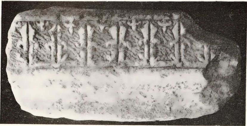
Εἰκ. 7. —Κουφικαὶ ἀνάγλυφοι διαζοσμήσεις ἐπὶ μαρμαρίνου ἐπιστελλίου (ἐκ τῶν γλυπτῶν τοῦ Βυζαντινοῦ Μουσείου).