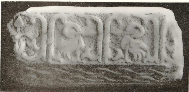
Εἰκ. 8. —Κουφικαὶ διαζοσμήσεις ἐπὶ μαρμαρίνου ἐπιστελλίου (ἐκ τῶν γλυπτῶν τοῦ Βυζαντινοῦ Μουσείου).