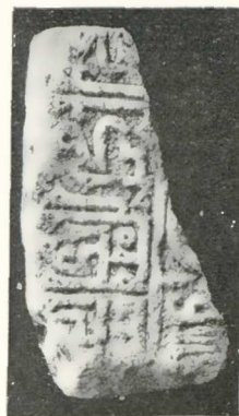
Εἰκ. 3 , Κορυφαὶ ἐπιγραφὴ (ἀποκειμένη ἐν τῷ Βυζαντινῷ Μουσείῳ).