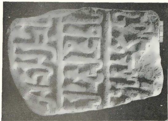
Εἰκ. 2 — Κορυφαὶ ἐπιγραφὴ εὐρεθείσα κατὰ τὰς ἀνασκαφὰς τῆς Ρωμαϊκῆς Ἀγορᾶς.