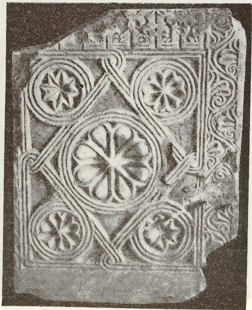
Εἰκ.—6. Βυζαντινὸν θωράκιον μετὰ κουφικῶν διακοσμημάτων (Βυζαντινὸν Μουσεῖον).

Τὰ ἀρχαιότερα δείγματα τοῦ βυζαντινοῦ κουφικοῦ διακόσμου εὐρίσκομεν ἐν Ἀθήναις κατὰ τὸν 10ον αἰῶνα· ἐν τῷ Βυζαντινῷ Μουσεῖῳ Ἀθηνῶν ὑπάρχουσι δύο μαρμάρινα θωράκια (εἰκ. 5-6) μεταφερθέντα ἐκ τῆς Ἀκροπόλεως καὶ προερχόμενα ἐκ