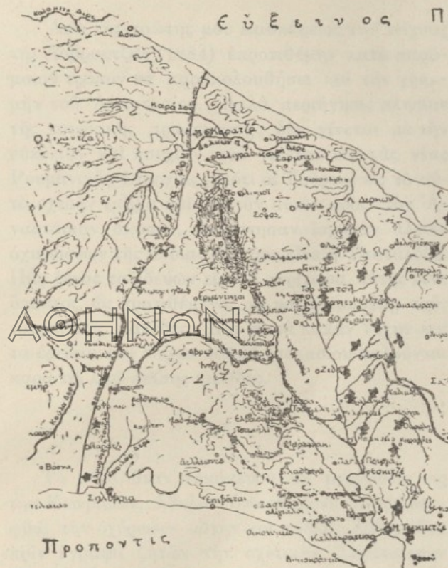
ΔΙΕΥΘΥΝΣΙΣ ΤΟΥ ΑΝΑΣΤΑΣΙΑΚΟΥ ΤΕΙΧΟΥΣ